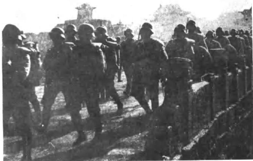
忻口会战时期中国抗日军队开上前线