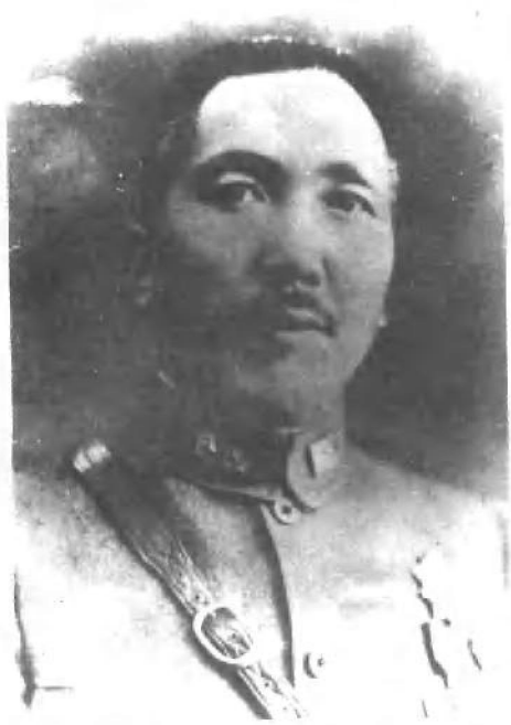
在忻口抗日战场上阵亡殉国的 中国陆军第九军军长郝梦麟将军