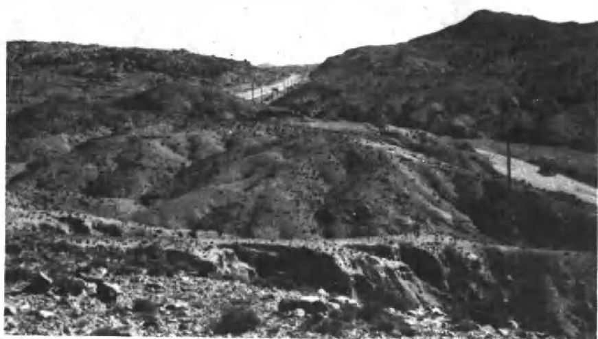
绥西抗战乌不浪口战场