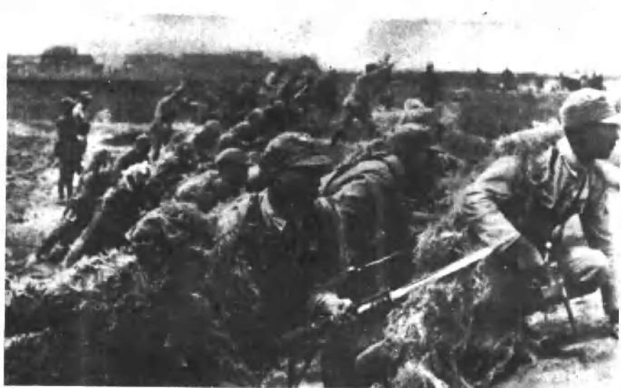
中条山中国抗日军队待命出击作战