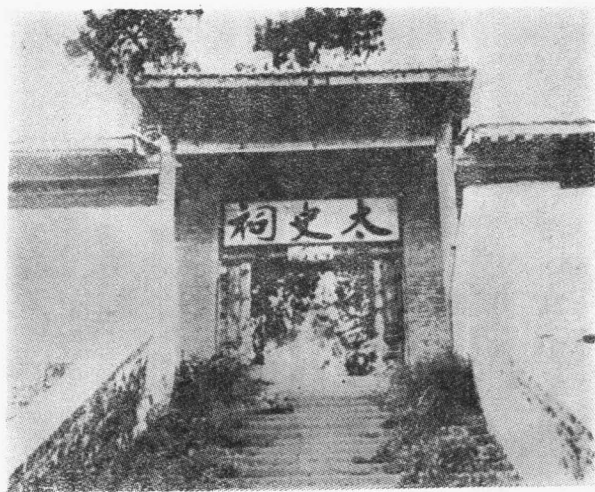
陝西韓城南芝川鎮 太史公祠正門