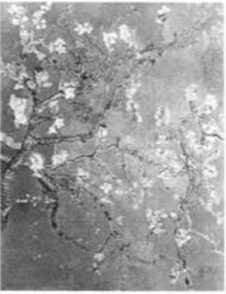
盛开的杏花 1890年 油画 帆布 73 × 92cm

Appreciation of World Famous Paintings, Van Gogh