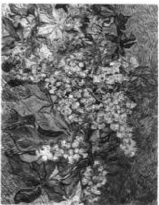
花满枝头 1890年 油画 画布 72 × 91cm

Appreciation of World Famous Paintings. Van Gogh