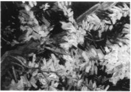
花满枝头 1890年 油画 画布 32.5 × 24cm

Appreciation of World Famous Paintings. Van Gogh