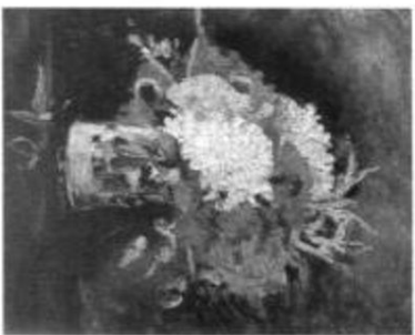
瓶中石竹 1886年 油画 帆布 40 × 32.5cm

Appreciation of World Famous Paintings, Van Gogh