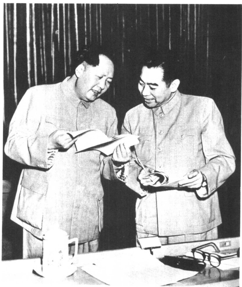
毛主席和周总理在中央人民政府委员会第二十四次会议上 (一九五三年)