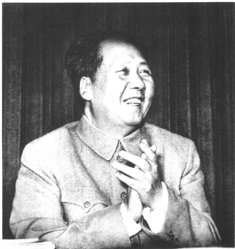
伟大的领袖和导师毛泽东主席 （一九五九年）