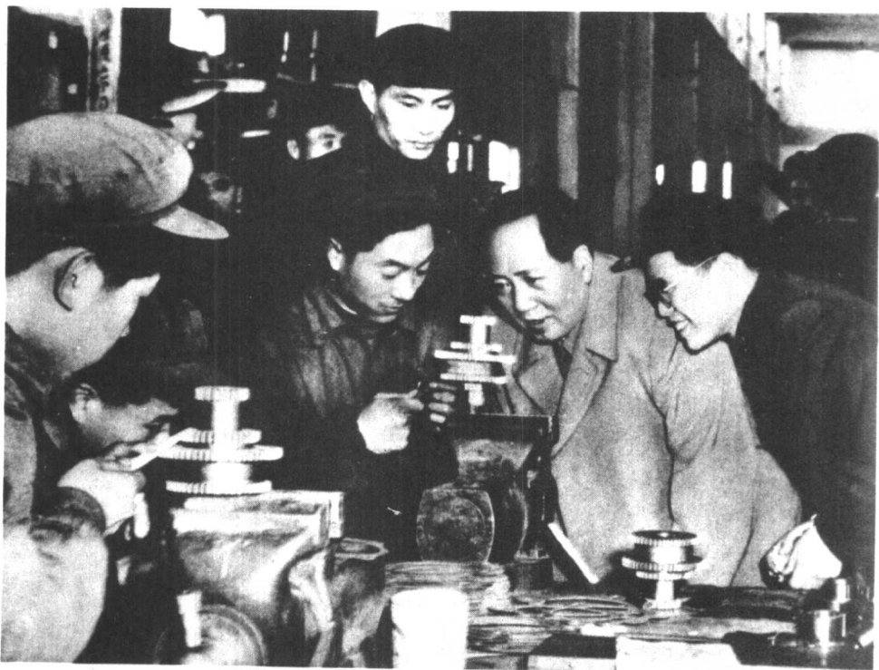
毛主席在工厂视察（一九五六年）