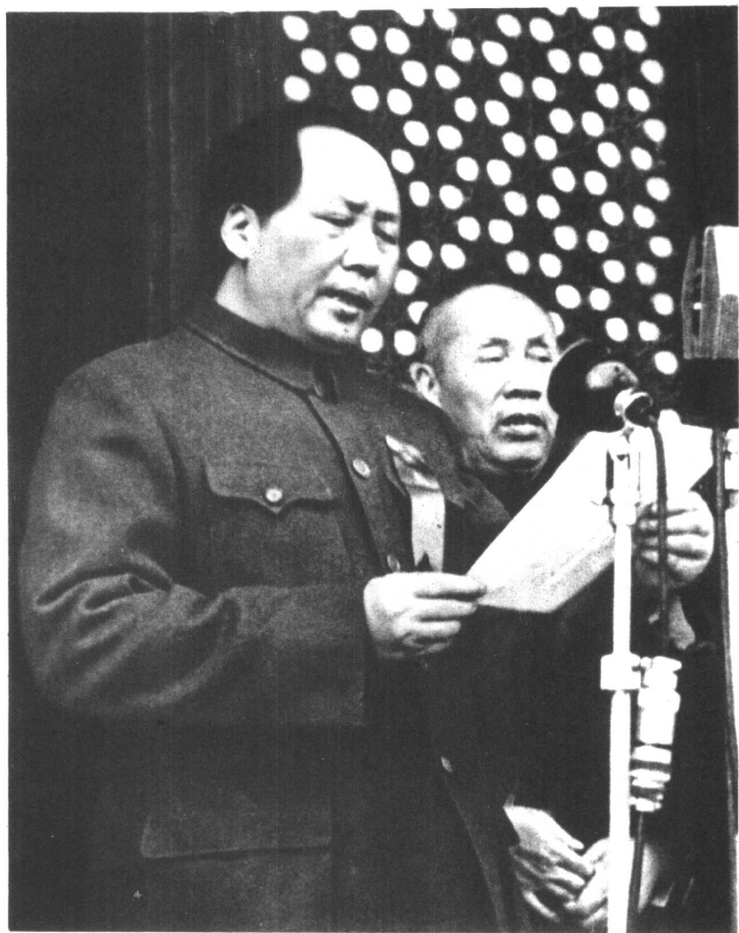
一九四九年十月一日，毛主席和董必武同志在天安门城楼上。