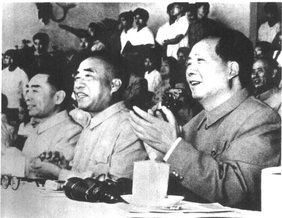
毛主席、朱委员长、周总理在第一届全国运动会主席台上 (一九五九年)