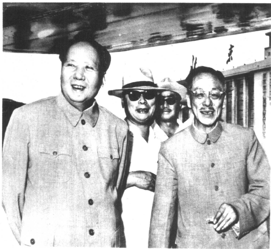
毛主席和康生同志、陈毅同志、贺龙同志在首都机场上 (一九六三年)