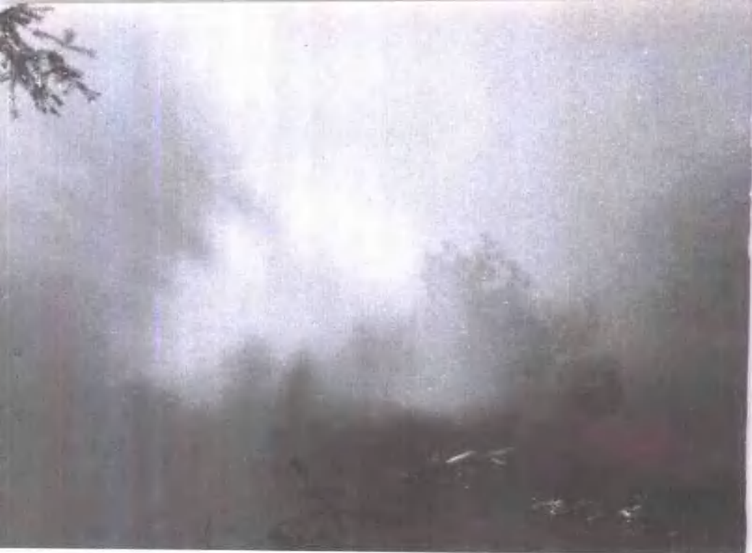
▲ 齐云佛光