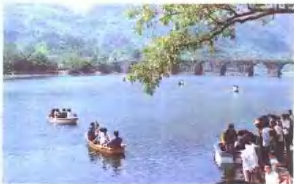
▶ 横江碧流