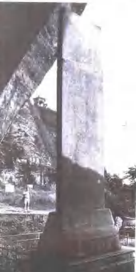
▲ 摩訶 方平山汪清揚

摩訶庵詩 摩訶庵詩之在摩訶庵西門外，一說不也。庵中 摩訶庵詩之在摩訶庵西門外，一說不也。庵中 摩訶庵詩之在摩訶庵西門外，一說不也。庵中 摩訶庵詩之在摩訶庵西門外，一說不也。庵中