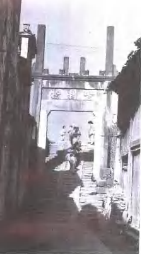
▲ 定封桥石桥