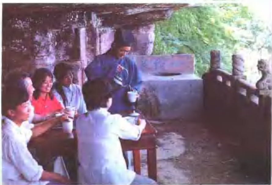
▼ 一线泉品茶