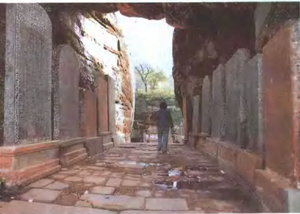
▼ 一天门碑林 厉福昆摄