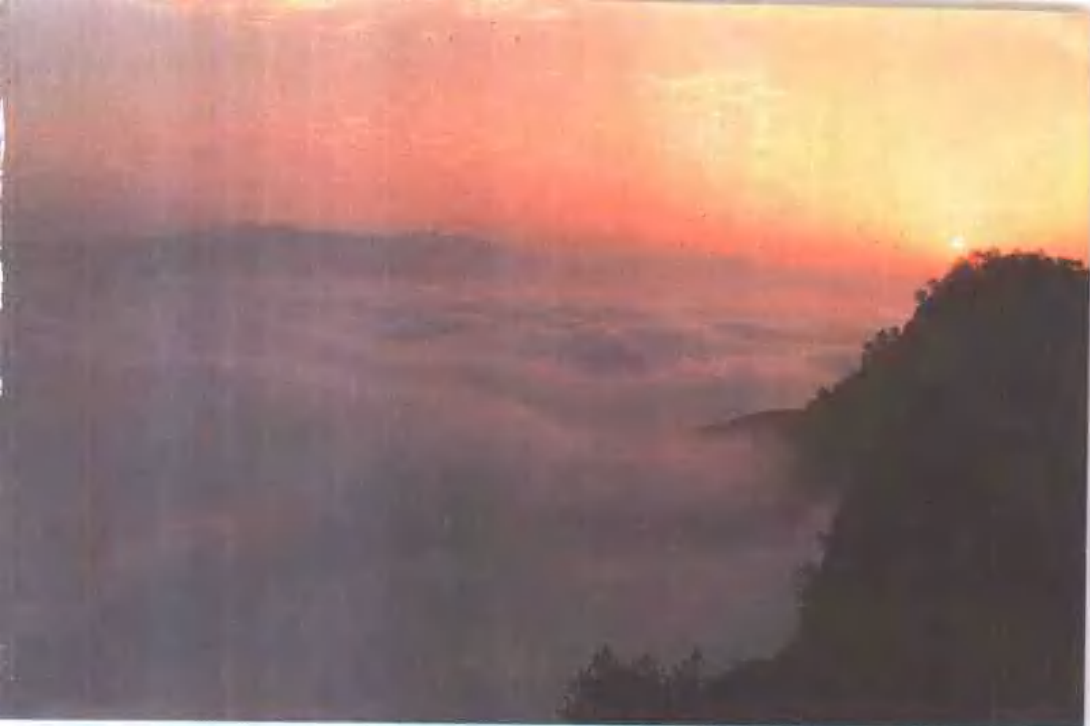
▲ 白岳云海