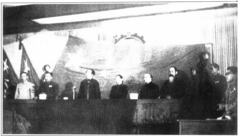
1949年9月30日，中国人民政治协商会议第一届全体会议选举毛泽东为中华人民共和国中央政府主席，刘少奇、朱德、宋庆龄、李济深（左五）、张澜、高岗为副主席。这是大会主席台。