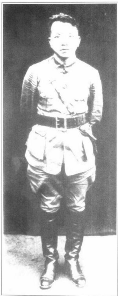
1927年北伐时期的李济深