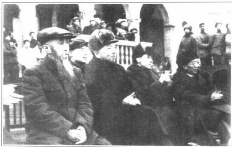
1949年1月，(前排左起)沈钧儒、李济深、郭沫若(左四)等到达沈阳。