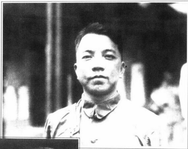
李济深在黄埔军校