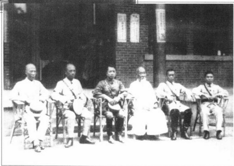
李济深(右四)、李宗仁(右二)、王芝祥(右三)等合影于北平。(王芝祥清末任广西知府，辛亥革命后被推选为广西副都督)