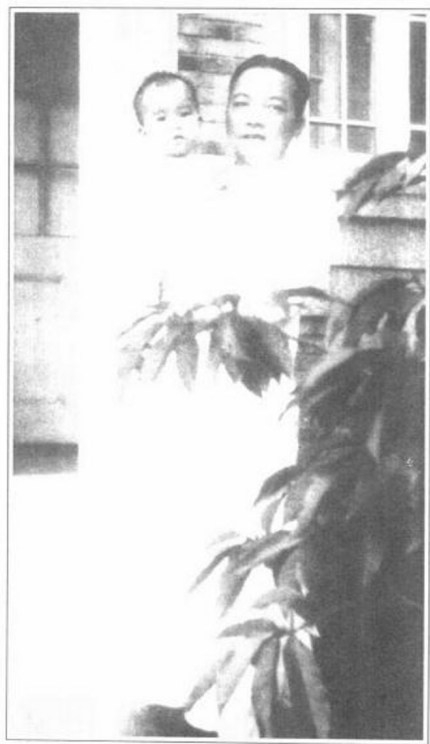
1931年李济深在南京任军事委员会办公厅主任兼训练总监时在其上海寓所前留影