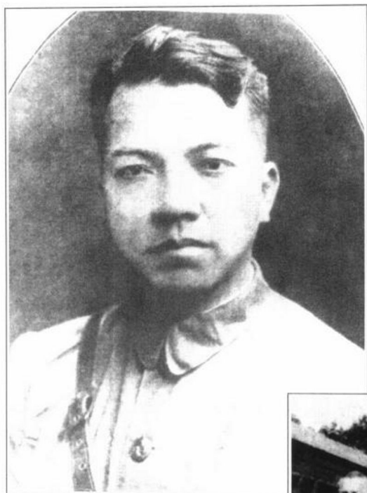
黄埔军校副校长李济深