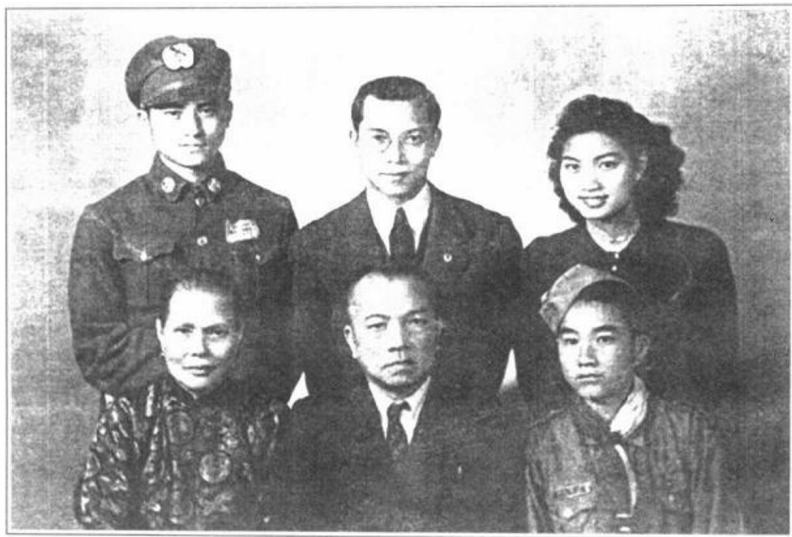
1946年4月10日，李济深偕夫人周月卿（前排一）、二子李沛金（后排中）去四川成都灌县视察空军幼年学校时摄。三子李沛钰（后排左）、四子李沛琼（前排右）为该校学生。