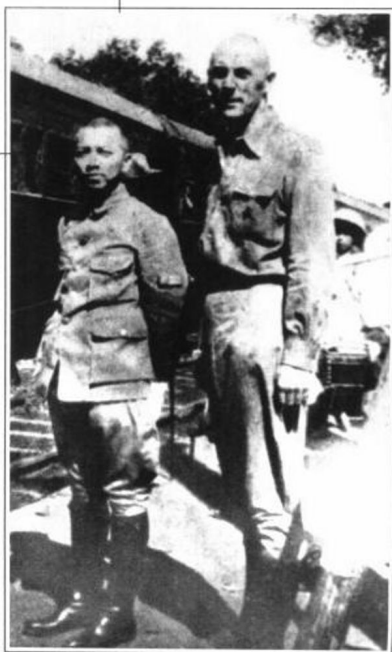
李济深与国民革命军 中的苏联顾问在东征途中