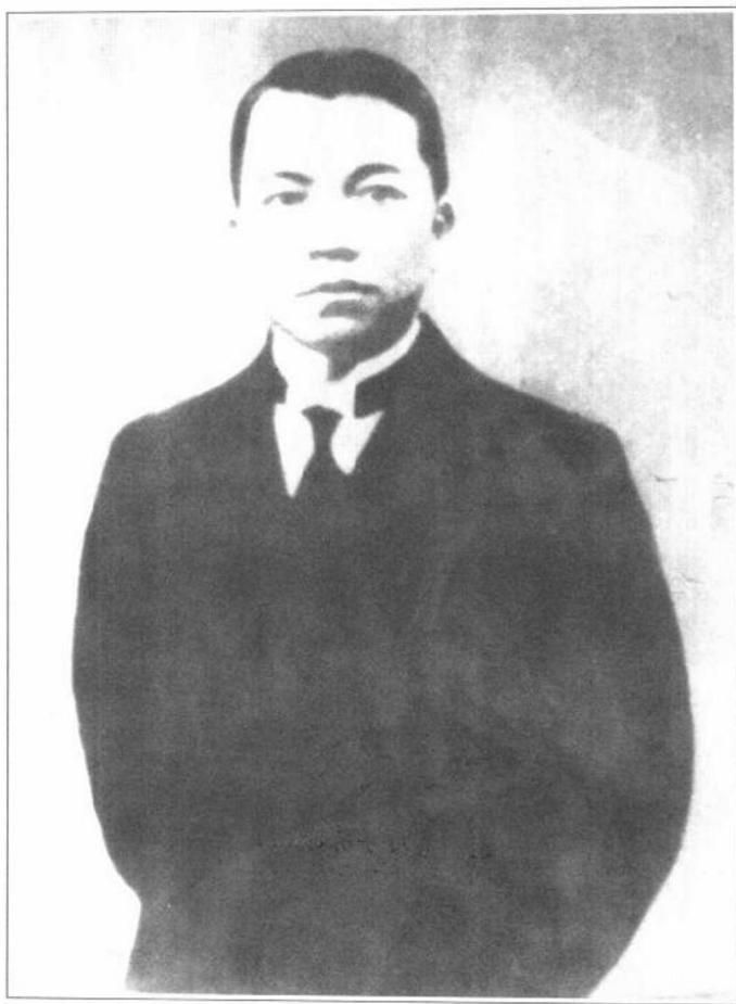
1918年，在北京陆军大学任教官的李济深。