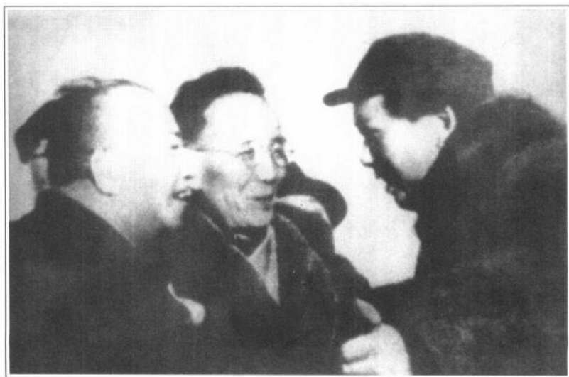
毛泽东与李济深（左一）、郭沫若亲切交谈。

1949年3月25日，中共中央和解放军总部由河北平山县西柏坡迁到北平，毛泽东、朱德等中共中央领导人到达后，郭沫若、李济深（前排左二）、沈钧儒、黄炎培、马叙伦、陈其瑗等民主人士前往西苑机场迎接。