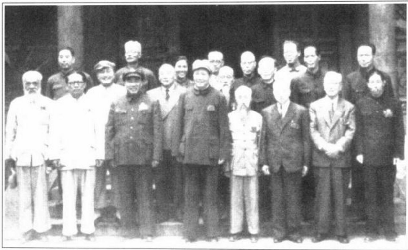
1949年9月，中国人民政治协商会议筹备会常务委员合影。前排左起：谭平山、章伯钧、朱德、毛泽东、沈钧儒、李济深、陈嘉庚、沈雁冰。

1949年9月21日至30日，中国人民政治协商会议第一届全体会议在北平举行。图为民革中央代表李济深签名报到。