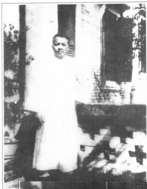
李济深摄于家乡广西 苍梧科神村宅中