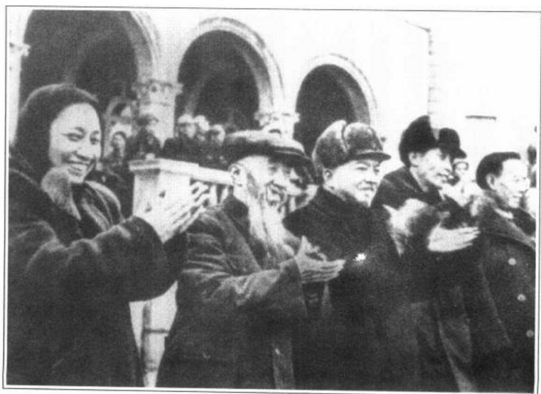
郭沫若、李济深(左三)、沈钧儒等民主人士到达沈阳后受到热烈欢迎