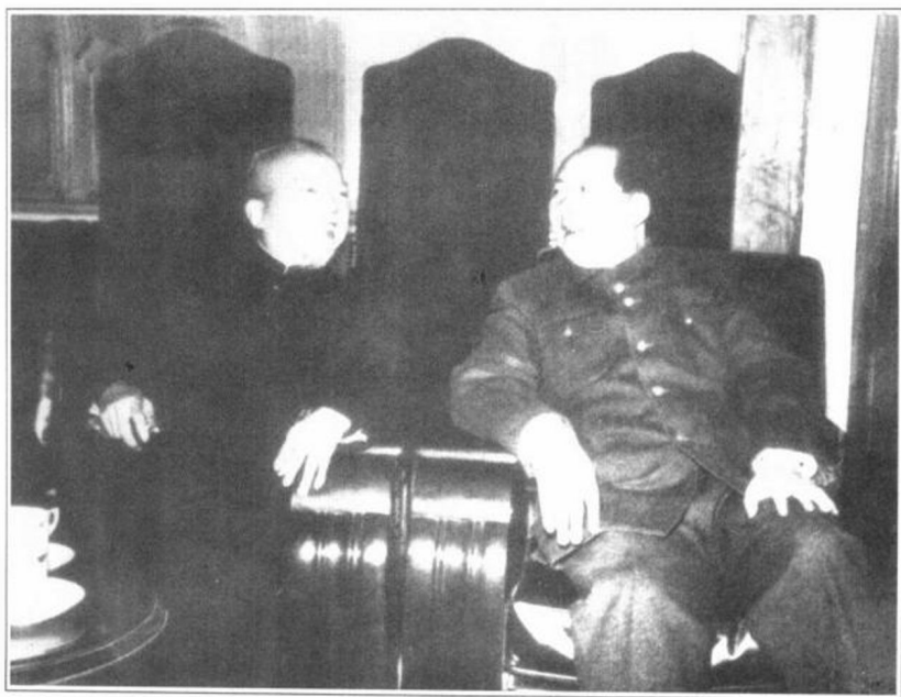
毛泽东与李济深亲切交谈