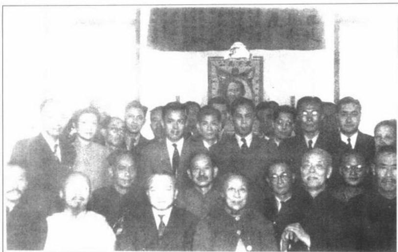
1948年1月，民革中央部分同志在香港合影。前排左起：朱蕴山、柳亚子、蔡廷锴、李济深、张文、何香凝、彭泽民、王葆真。