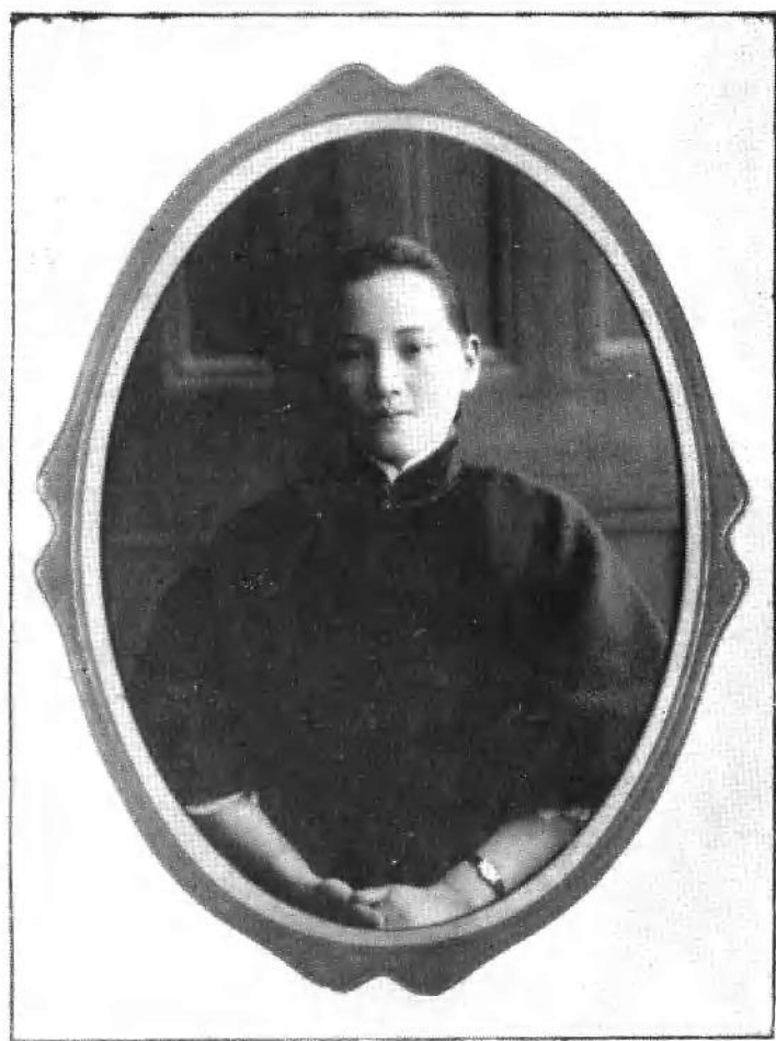
1927年在武汉任国民政府委员和 国民党中央政治委员会委员时留影