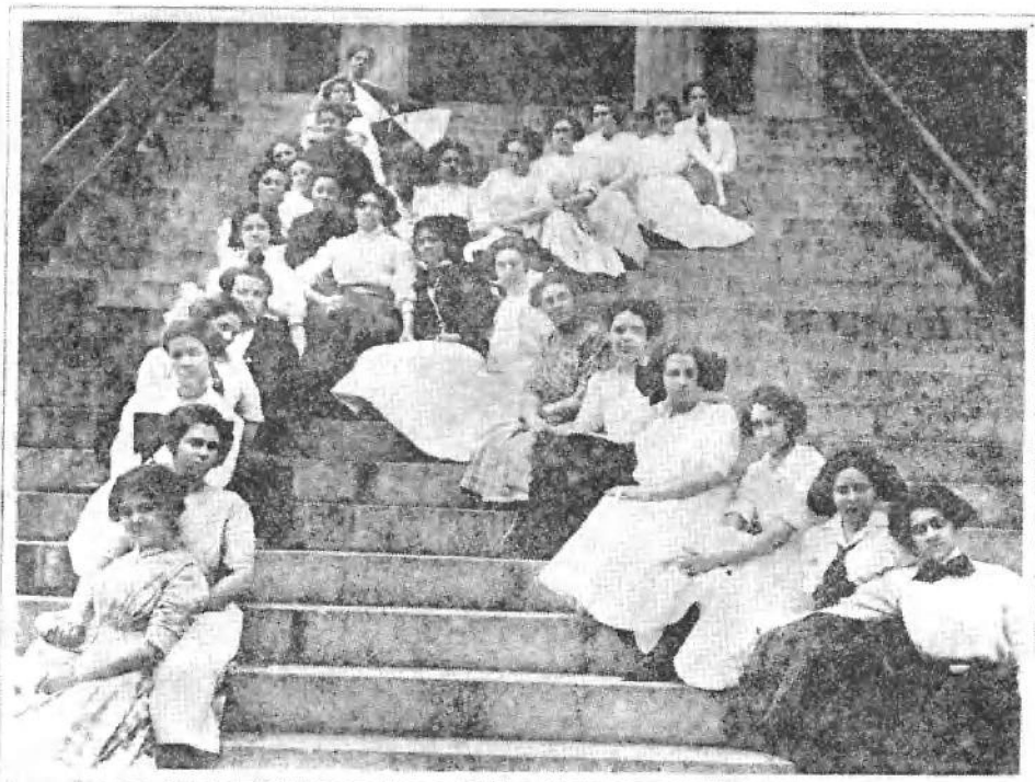
宋庆龄和威斯里安女子学院同班同学的合影。K字中间右下起第八人。