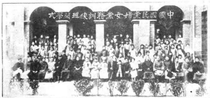
1927年2月宋庆龄（前排左八）在武汉开办的妇女政治训练班的开学典礼上与师生合影。前排右五为董必武。