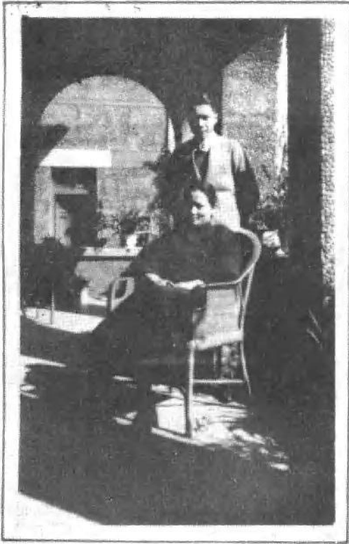
宋庆龄在上海住所与 弟弟宋子文合影。