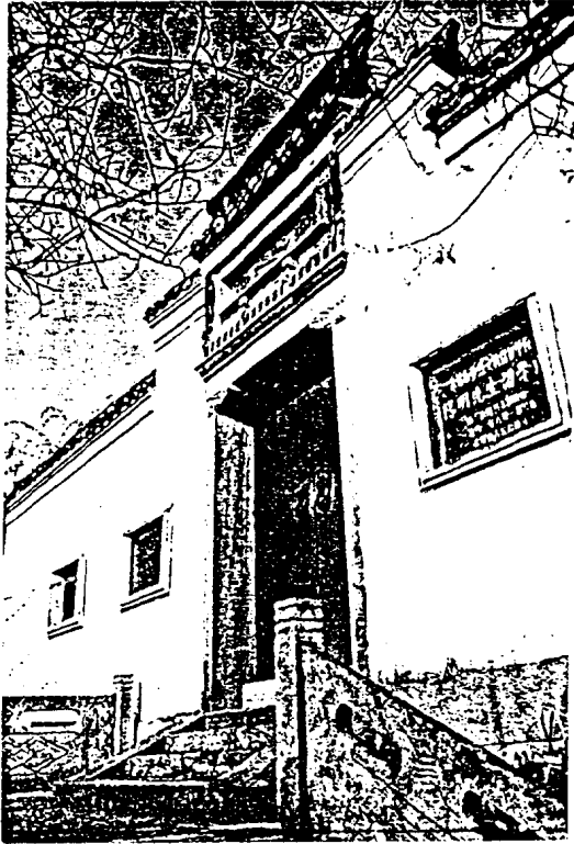
浙江余姚龙泉山王守仁讲学处