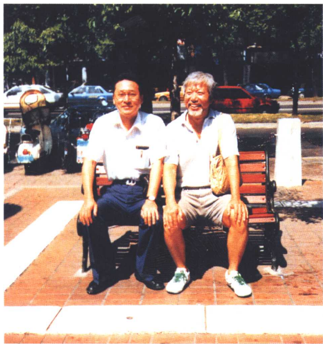
两老无猜——李敖和孟绝子（孟祥柯）