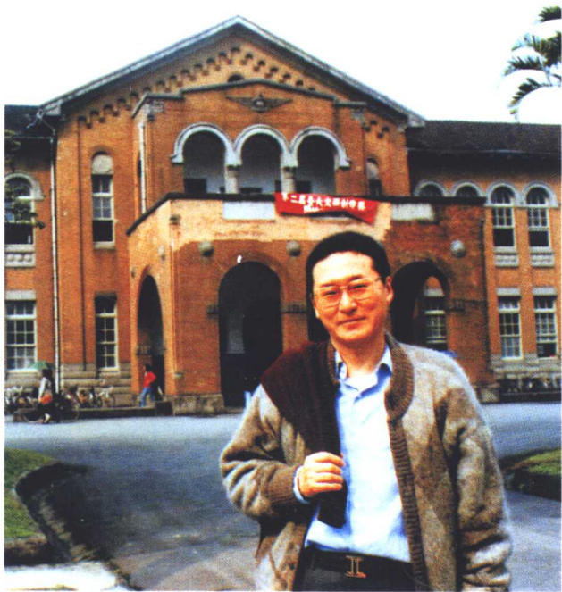
多年以前，面对文学院；多年以后，背对文学院