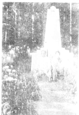
1950年夏某地， 毛岸英和李克农在一起。