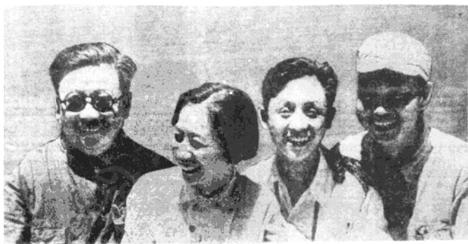
李克农与夏之栩、童小鹏、龙潜同志合影