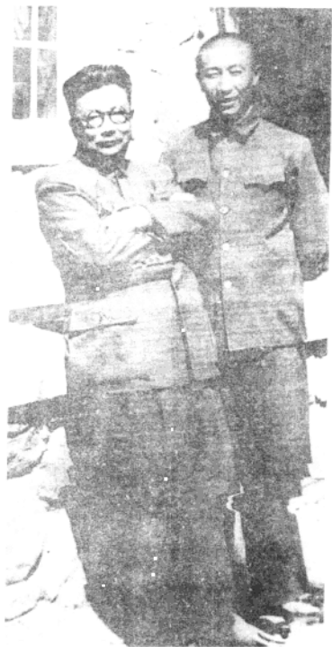
李克农与解方将军在一起。