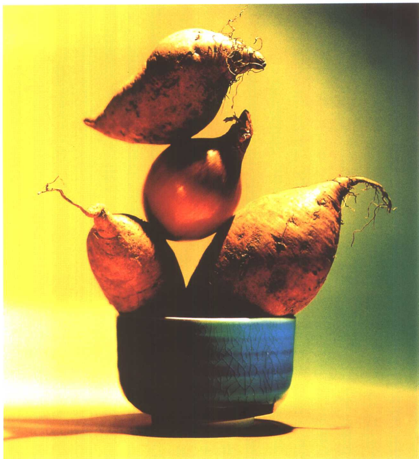
(美国) Craig Cutler