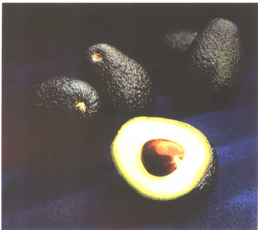
(美国) Susumu Sato