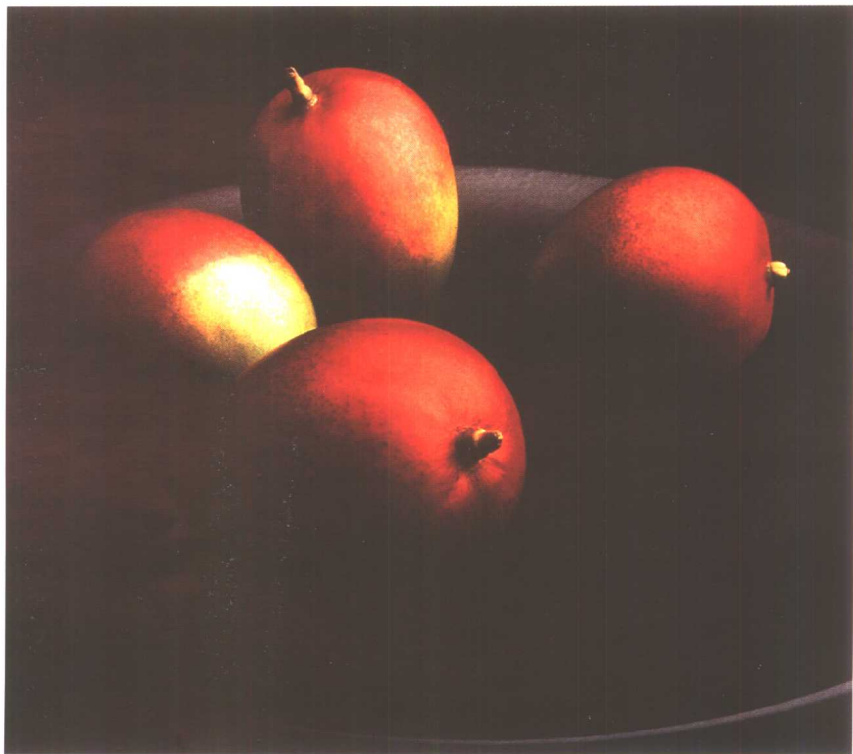
(美国) Susumu Sato