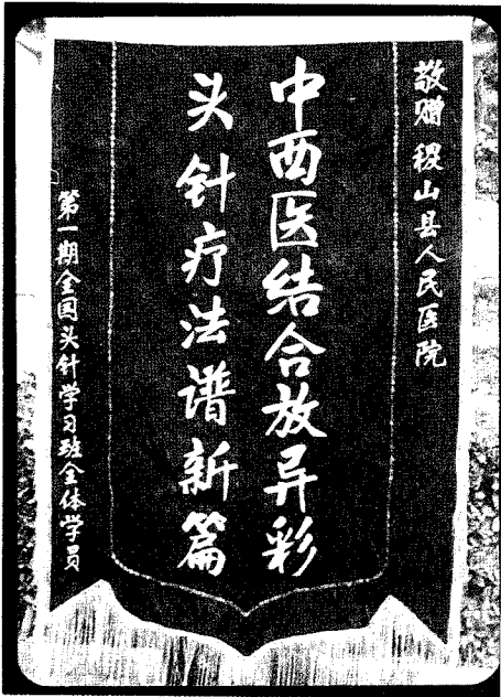
图(1-4) 1971年 全国头针学习班赠旗