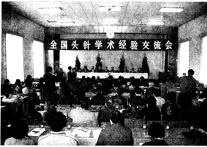
图(1-3) 全国头针学术经验交流会在运城召开