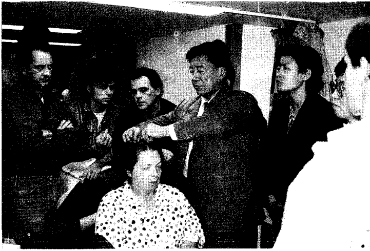
图(1—5) 在加拿大办头针学习班