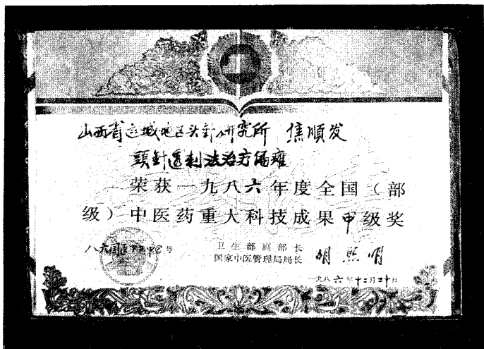
图(1—6) 头针获全国中医药重大科技成果甲级奖