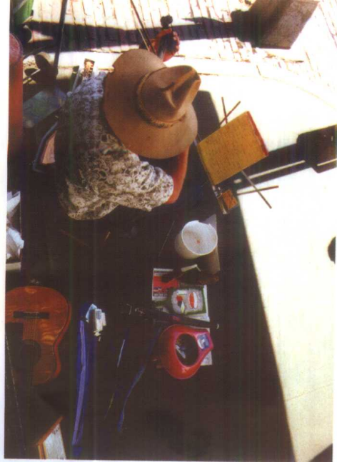
欧洲民间拉弦乐器