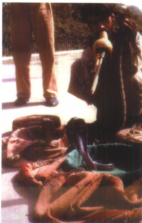
印度耍蛇艺人乡村乐手