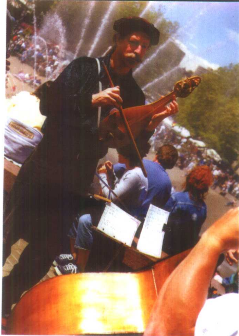
乡村乐手