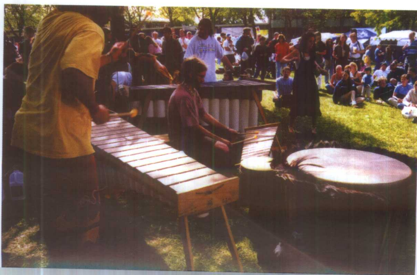
马林巴合奏