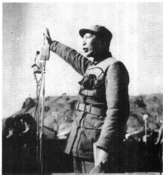
聂荣臻在庆祝抗战胜利大会上讲话