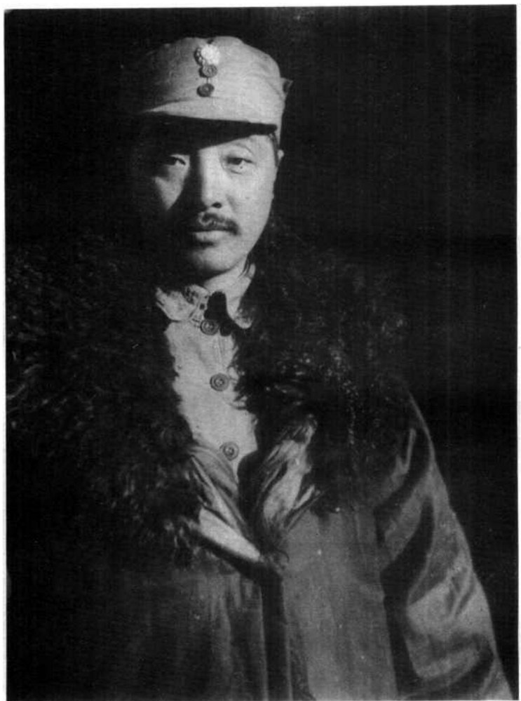
贺龙在晋察冀留影