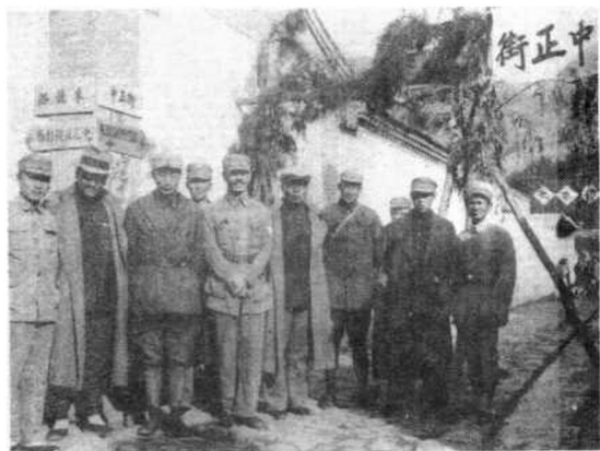
一九三八年六月，白求恩到达晋察冀边区。图为边区军政首长聂荣臻、宋劭文等与白求恩在五台县的合影。