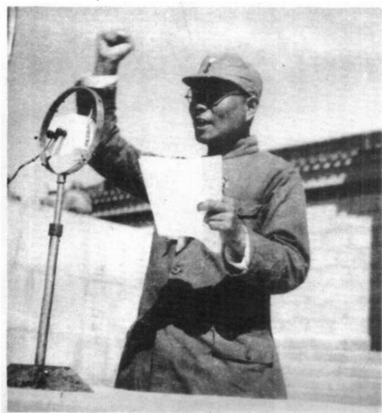
宋劭文在庆祝抗战胜利和张家口解放大会上讲话