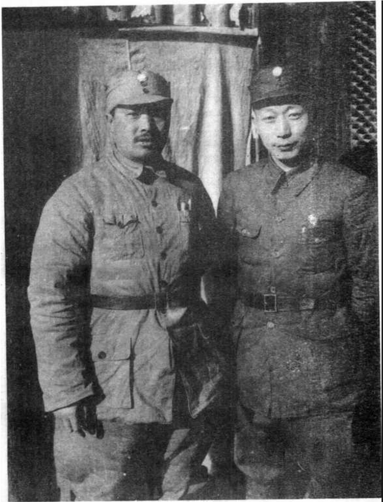
晋察冀开创时期的聂荣臻和贺龙