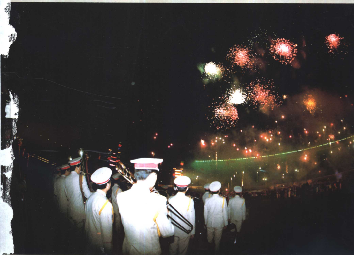
军乐演奏(由本书作者供稿、摄影程更新)