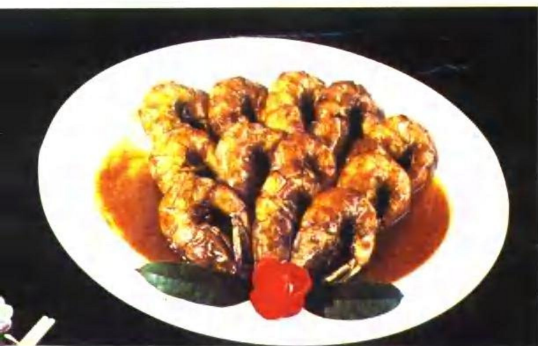
油 爆 虾