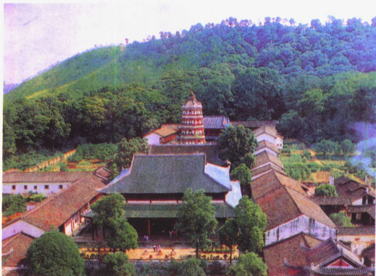
广东韶关南华禅寺