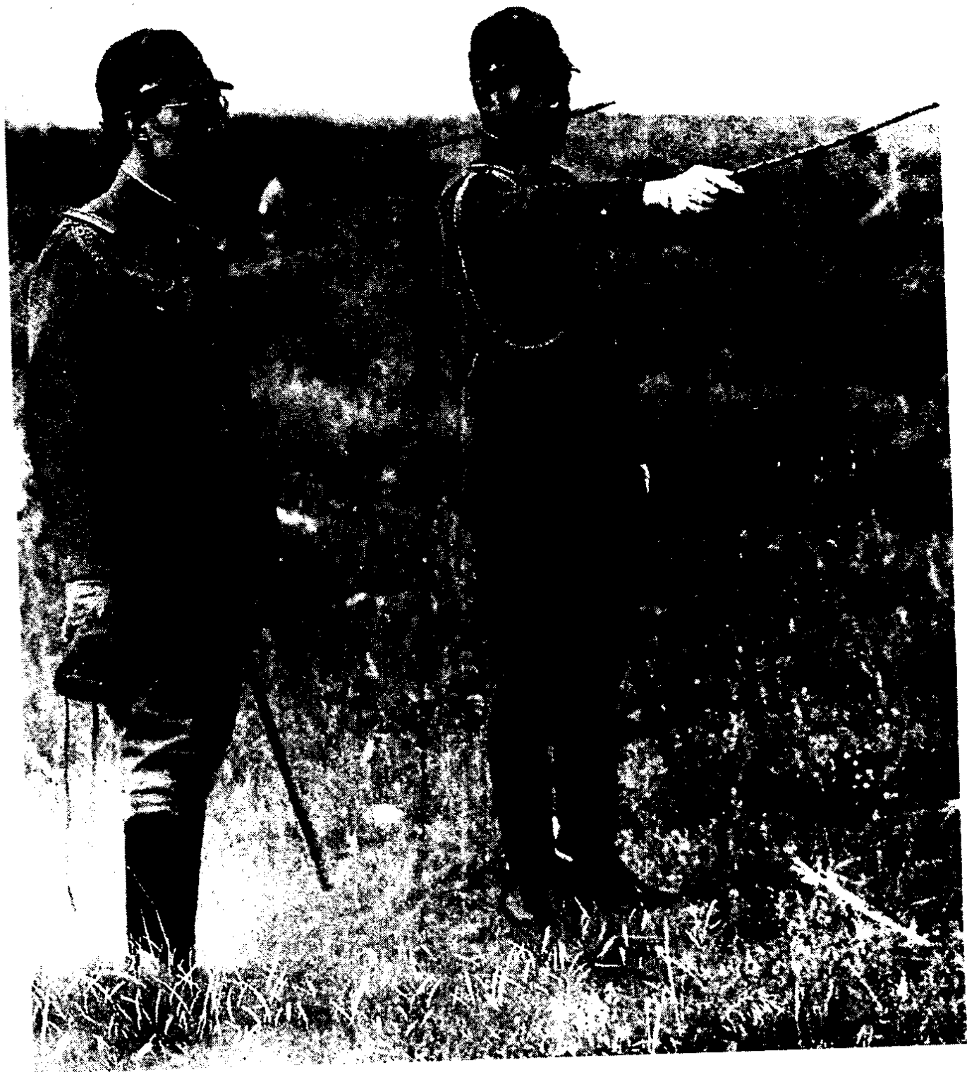
日本帝国秩父宫殿下亲临南京雨花台指挥屠城