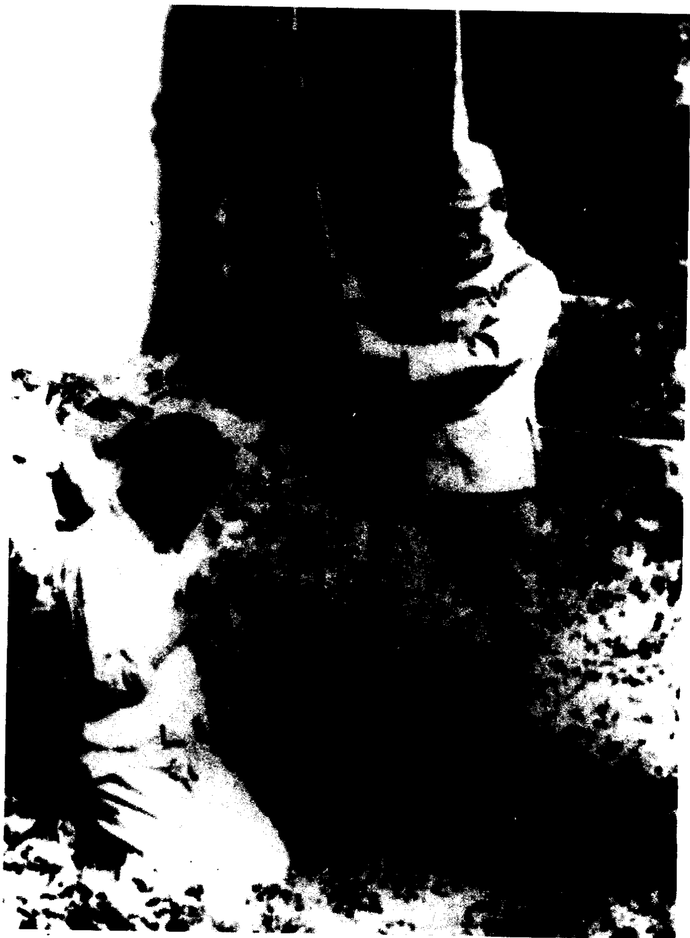
鬼子兵屠刀下面的难民