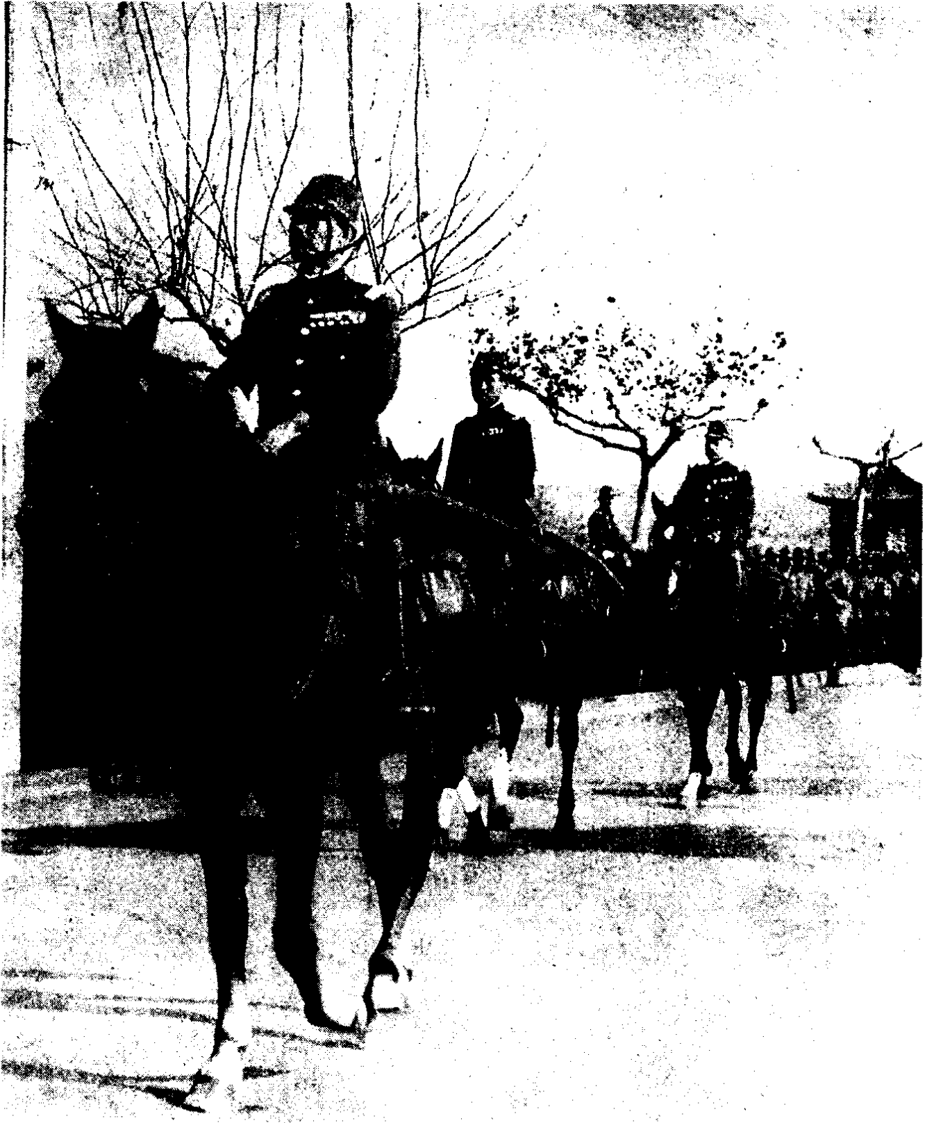
鬼子兵侵入南京组织的入城阅兵式