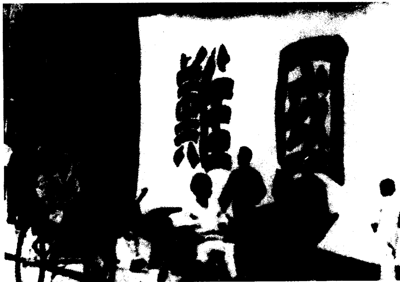
上海南京路三新百货公司前悬挂着大字“国难”横幅