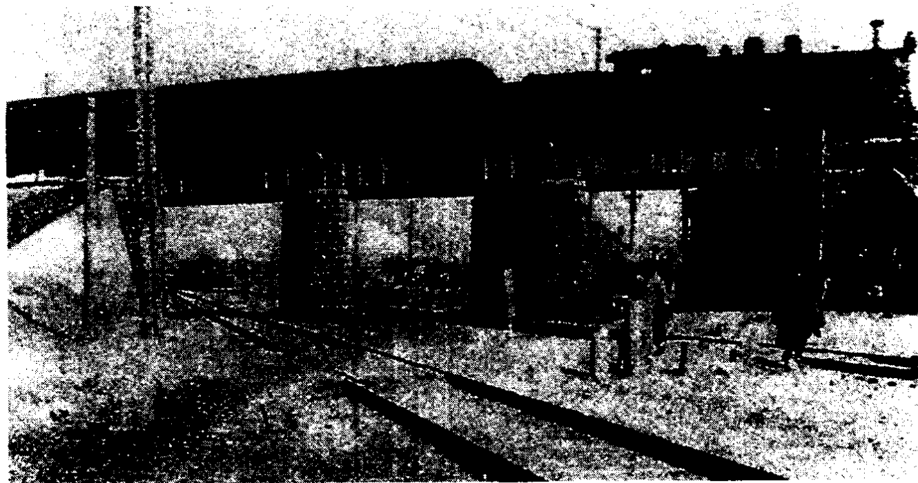
“皇姑屯事件”现场(爆炸之前)