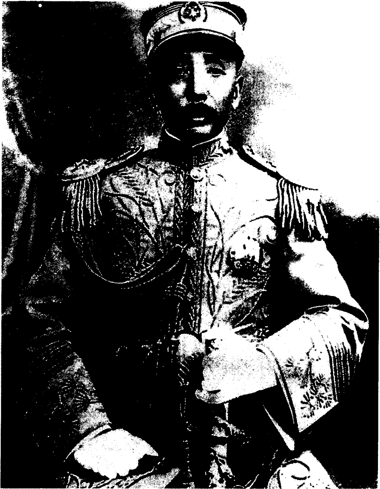
皇姑屯事件中被炸死的张作霖