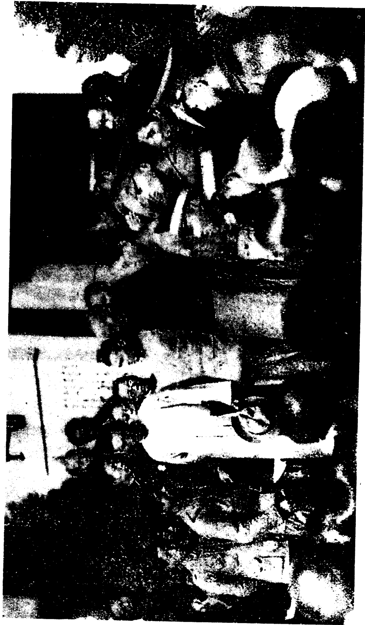
蒋介石在南京接见要求国民政府出兵抗日的学生请愿团代表