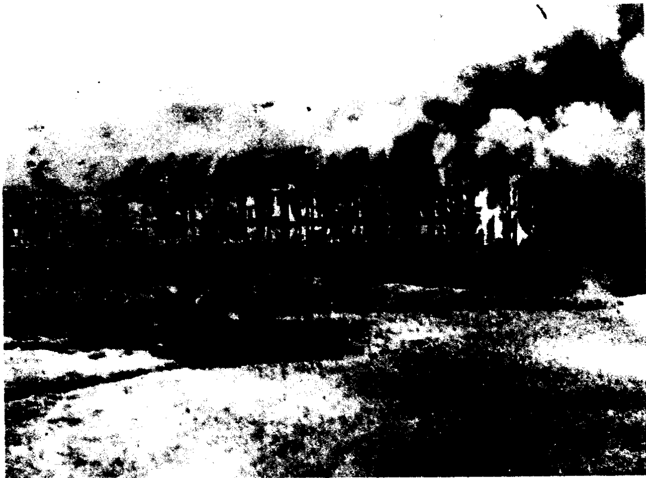
皇姑屯事件爆炸现场