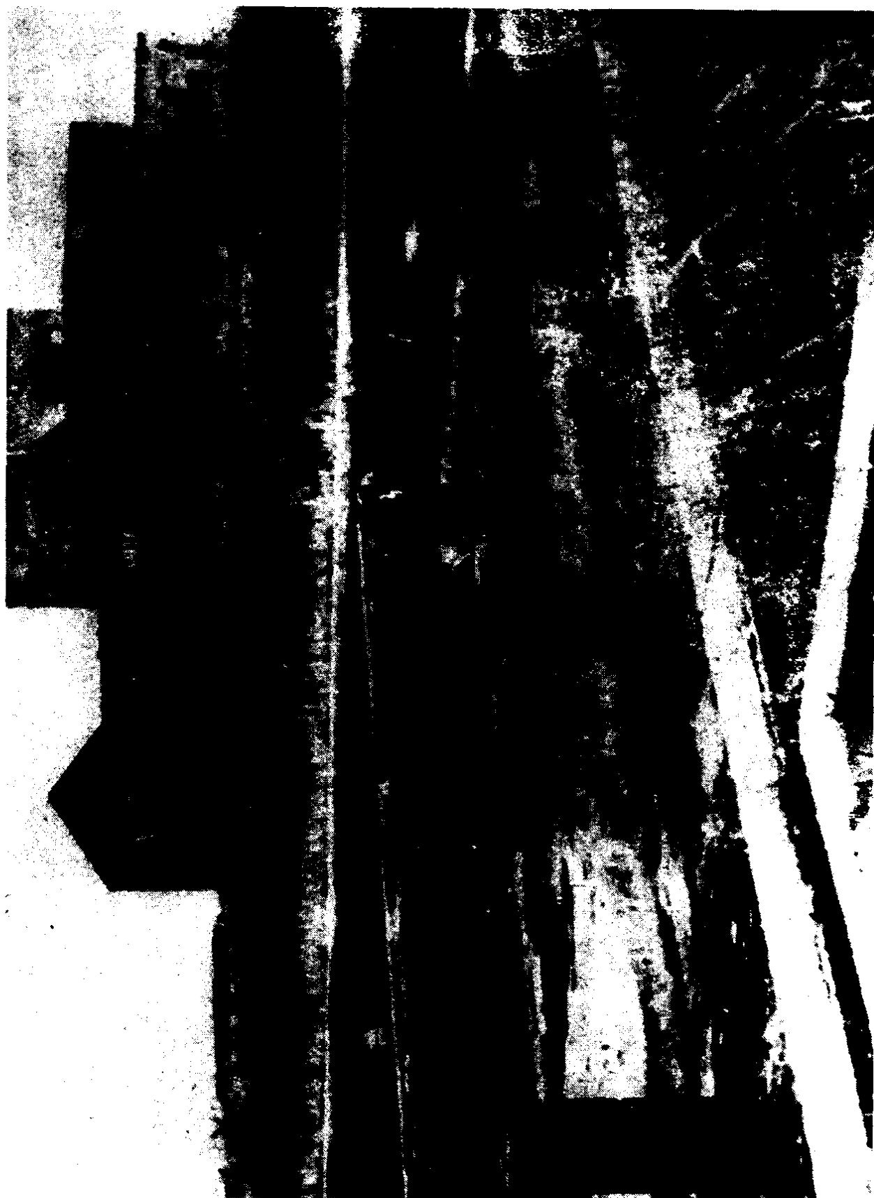
鬼子兵在哈尔滨的细菌工厂。在这里鬼子兵残酷地对战俘进行人体细菌实验