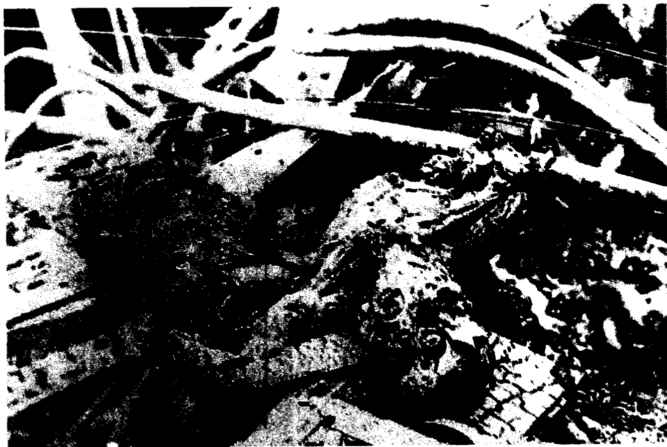
皇姑屯第一个殉难者