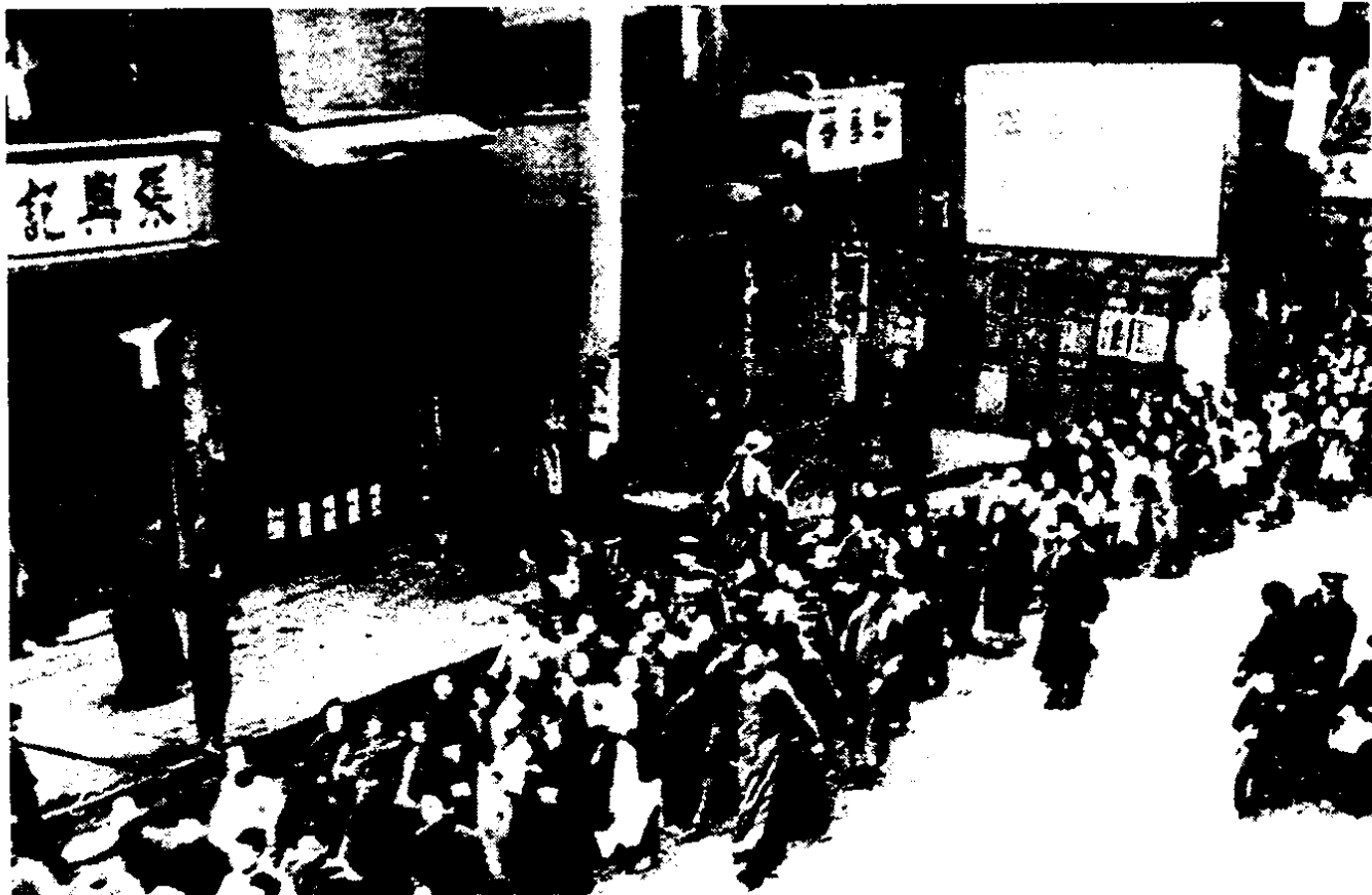
12月19日、20日，上海各大中学校学生举行示威游行，向上海当局请愿抗日救国，声援北平学生