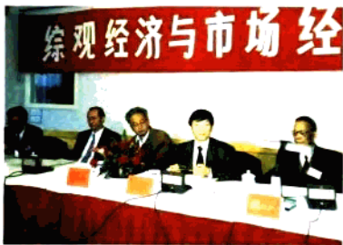
图五：李广维省长讲话。