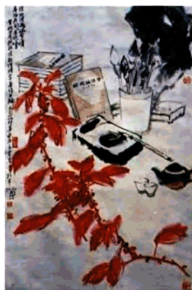
（图一）魏傑楓教授執教五十周年 北京清華大學（左）陳明，香港南嶺翠苑生， 汕頭自甘天無石，分研字恩肯与台， 廣港春尚唯與李，明制升己育與林， 晚景夕陽紅似天，秋秋一什吾生來， 學生后作詞撰 董百振書