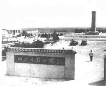
临西县智伍庄东南“四·二九”烈士陵园全景