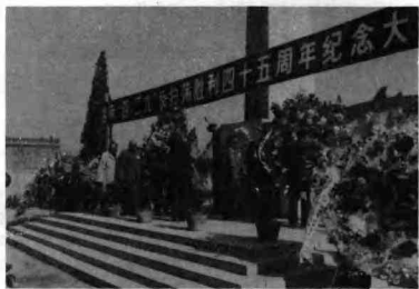
中共河北省委、省政府领导同志和原冀南老干部代表向烈士敬献花圈。