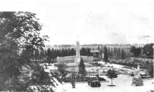
莒城县军店东南“四·二九”烈士陵园全景