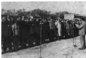
1987年4月29日，中共河北省委、省顾委、省政府分别在故城县霍庄和临西县贺伍庄，隆重召开纪念“四·二九”反扫荡胜利45周年大会。上图为故城县霍庄大会会场，中共河北省委书记邢崇智在纪念大会上讲话；下图为临西县贺伍庄大会会场，原冀南新四旅参谋长陈明义在纪念大会上讲话。