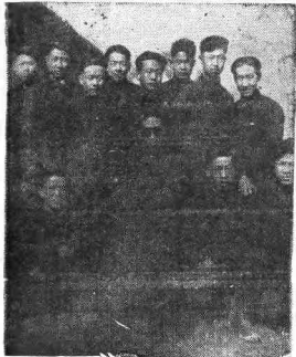
茅盾与新疆学院教 育系学生合影（中间戴 墨镜者为茅盾）