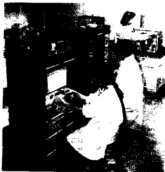
山西省化纤研究所

农村经济体制改革取得成功。解放后,全省农村进行了轰轰烈烈的土地改革运动,彻底根除了封建土地所有制对广大农民的长期压迫和剥削,实现了耕者有其田。与此同时,经过互助组、初级农业生产合作社和高级