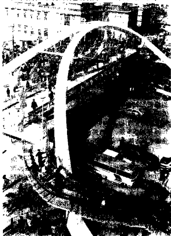
太原市宽银幕人行过街桥

科技事业成绩斐然。山西科技队伍从建国初期的力量薄弱,种类不全,已发展成为现在的具有高、中、初三级结合,包括工程、农业、卫生、科研、教育等在内的覆盖经济社会的多学科、全方位、跨行业的科研队伍,特别是党的十一届三中全会以来,山西科技事业发展进入了新阶段,科研机构日趋完善,科研成果相继问世,并与生产实践相结合,有力地促进了社会生产力的发展。1990年,全省自然科技人员已发展到32.4万人,相当于