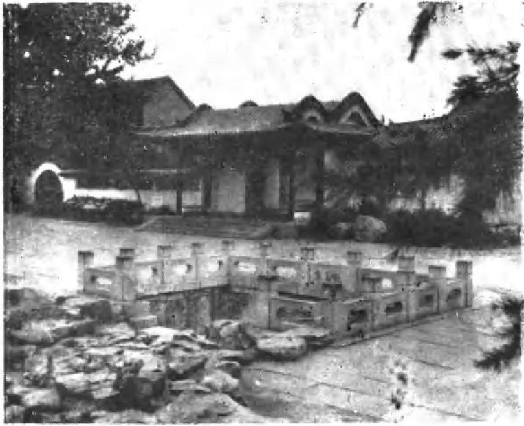
山东济南李清照纪念堂