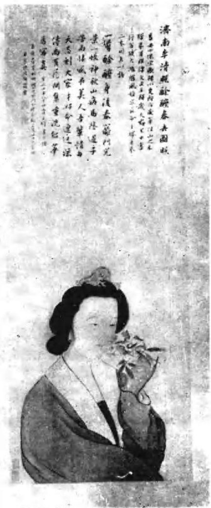
李清照醉餘春去圖照