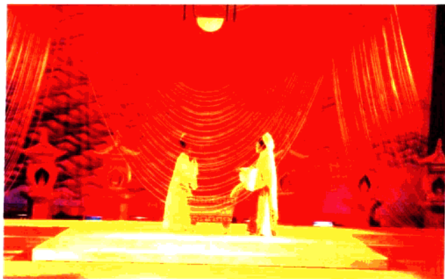
越剧《荆钗记》 温州市越剧团演出(1998年)