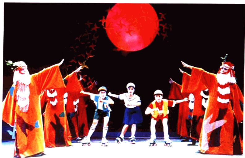
儿童剧《手拉手,我们是朋友》 浙江儿童艺术剧团演出(1995年)