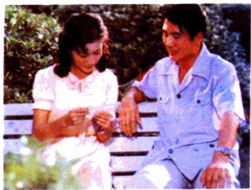
电影《何处不风流》 浙江电影制片厂摄制(1985年)