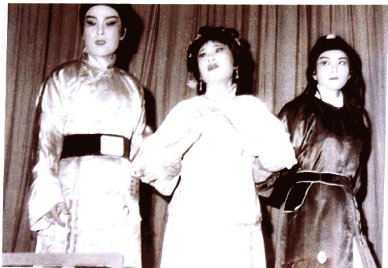
越剧《浮生六记》温州市越剧团演出(1985年)