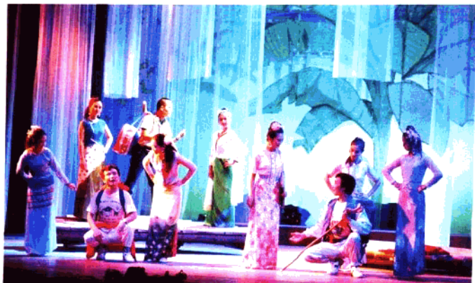
越剧《孔雀街新潮》 浙江越剧院演出(1989年)