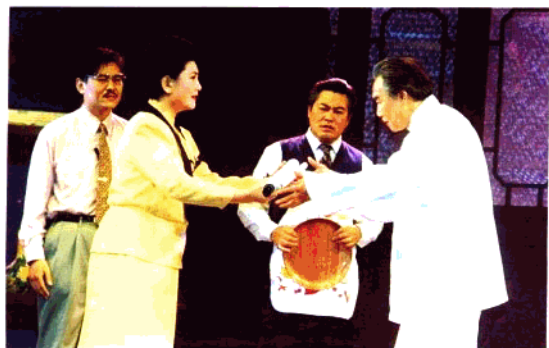
话剧《追梦》 浙江话剧团演出(1994年)