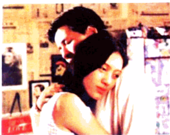
电视连续剧《再给我一个微笑》 浙江电影制片厂、温州电视台摄制(1997年)