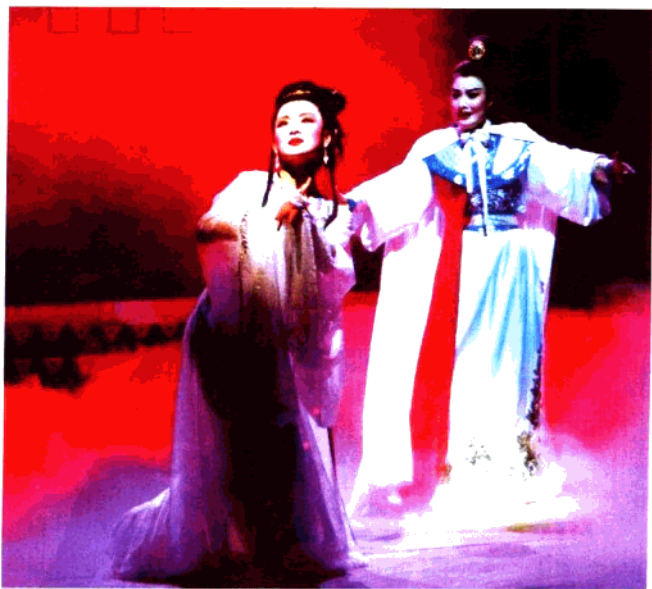
越剧《国色天香》 宁波小百花越剧团演出(2000年)