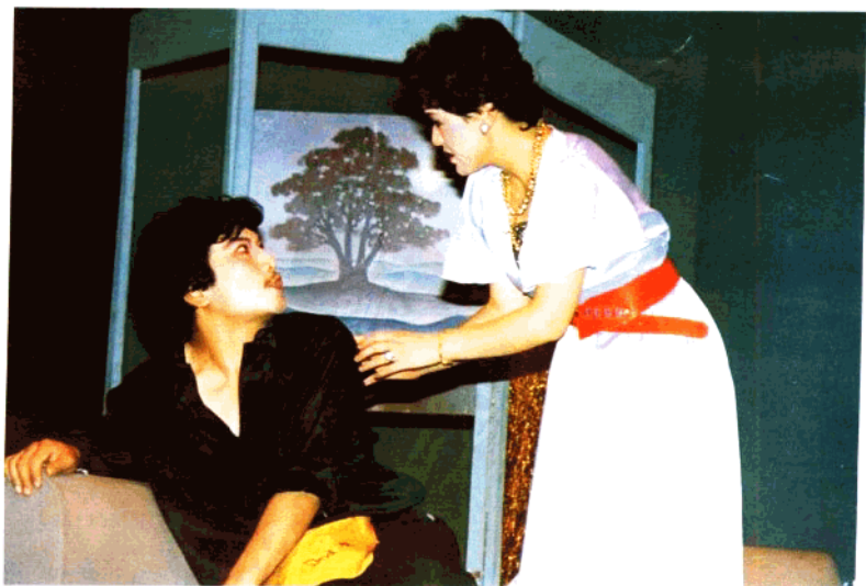
话剧《女老板秘史》浙江话剧团演出(1987年)