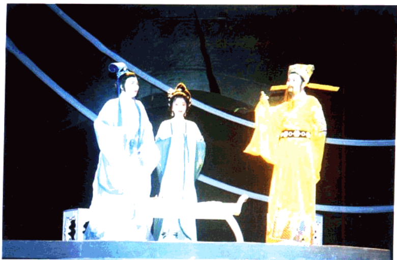
越剧《南唐遗事》 浙江小百花越剧团演出(1994年)