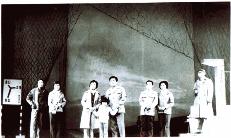
话剧《车队从这里经过》杭州话剧团演出(1984年)