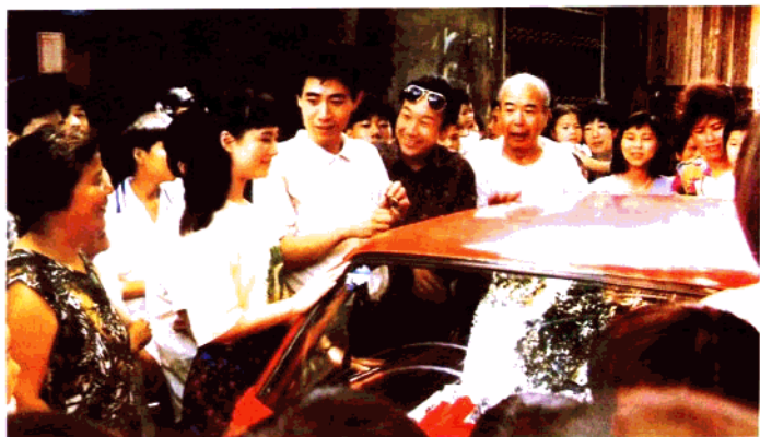
电视连续剧《喂，菲亚特》 浙江、温州电视剧制作中心联合摄制(1991年)