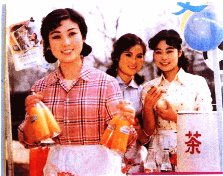
话剧《光明行》温州市文工团演出(1981年)