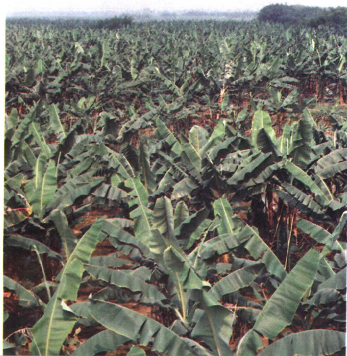
天 宝 香 蕉