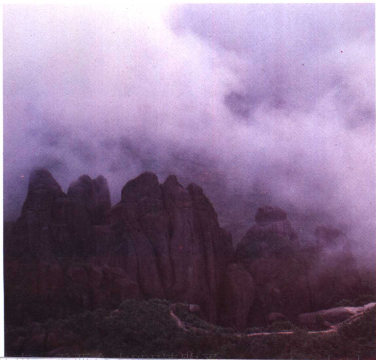
太姥山(花岗岩地貌)