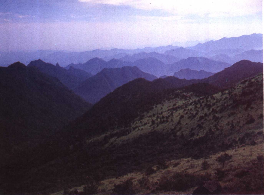
武夷山自然保护区林海