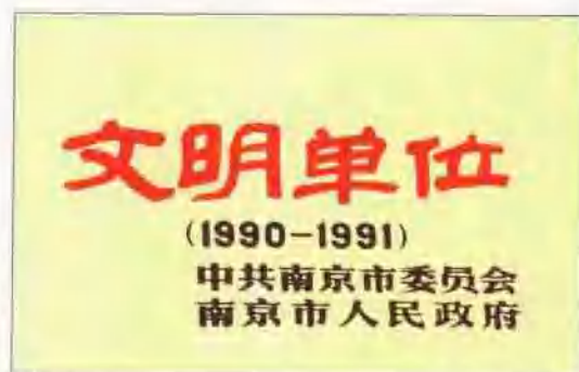
荣获南京市“文明单位”称号