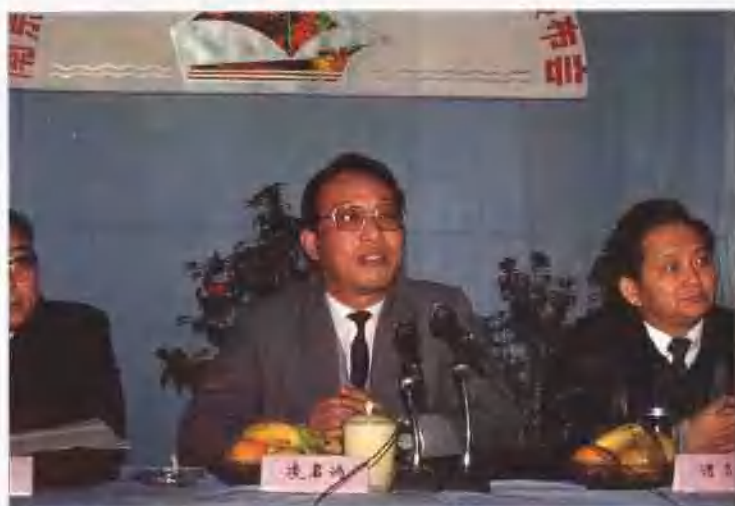
江苏省副省长凌启鸿来厂参加航运出灰工程投产总体验收