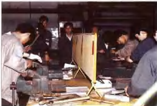
技术练兵—钳工比赛