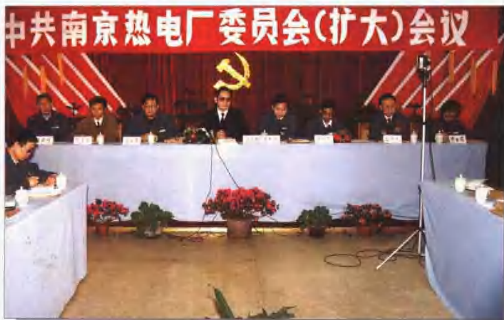
1994年度党委扩大会议