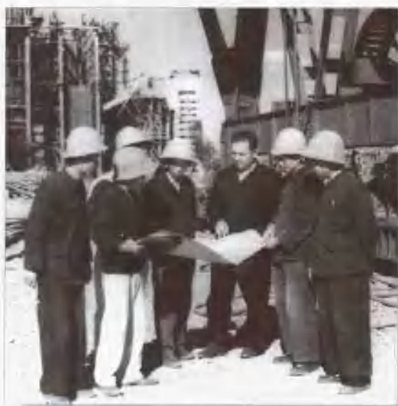
第一期工程中外专家在工作现场研究施工方案