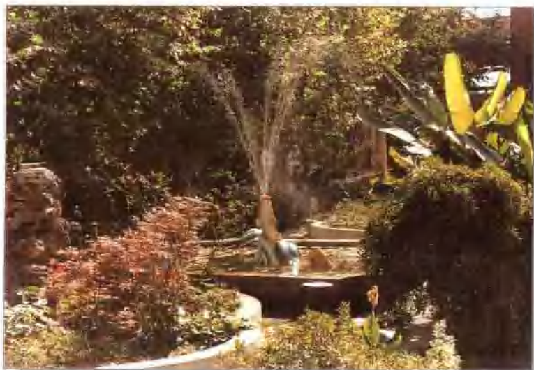
美化绿化环境之二