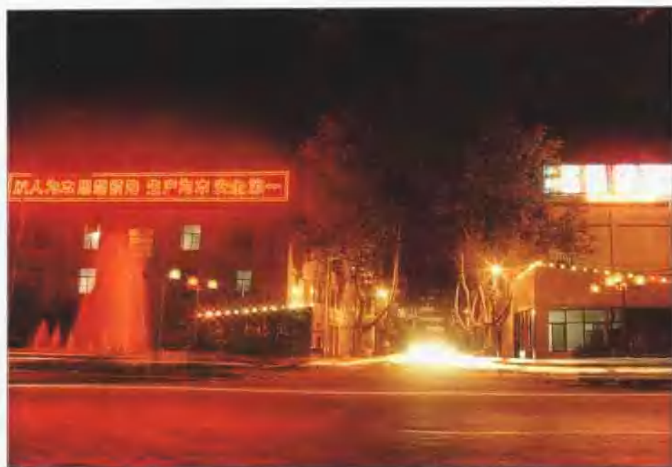
南京热电厂一号门夜景