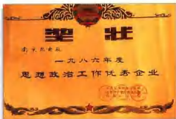
中共江苏省委宣传部、省计经委、省总工会授予“思想政治工作优秀企业”