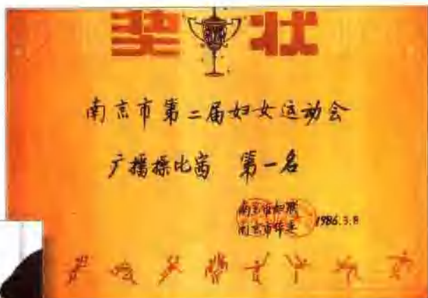
荣获南京市广播操比赛第一名