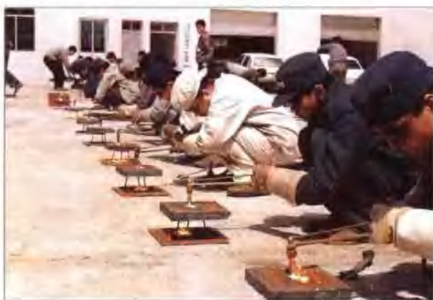
技术练兵—焊工比赛