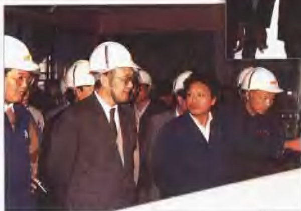
黄毅诚部长深入生产第一线视察