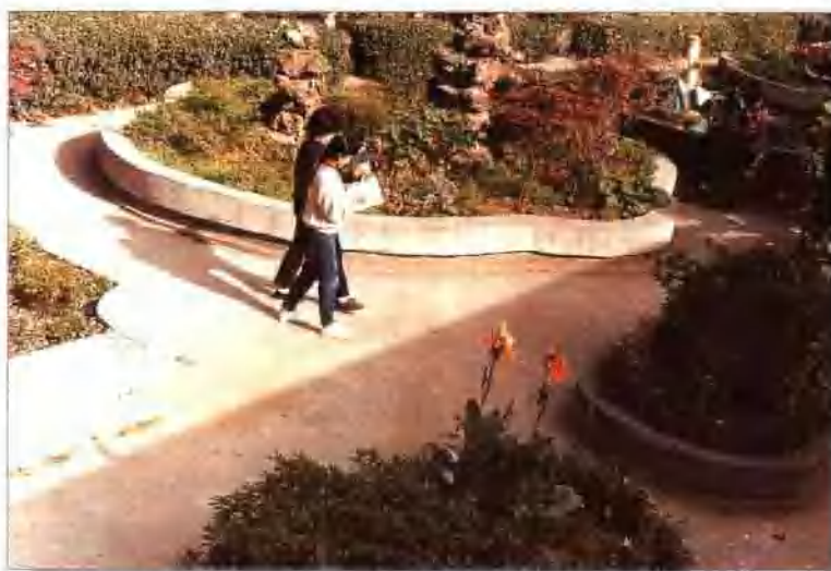
美化绿化环境之一