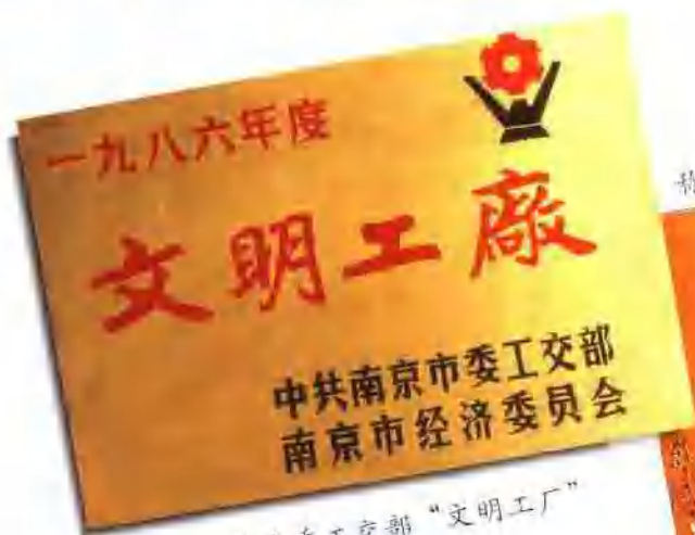
荣获南京市委工交部“文明工厂”称号