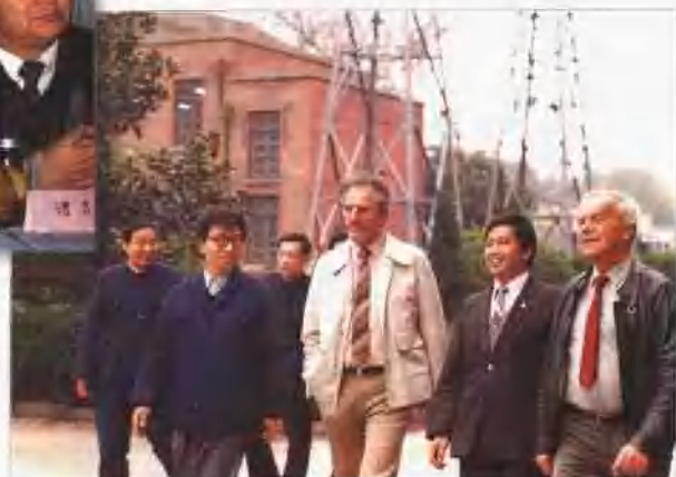
1986年10月4日加拿大安大略省友好代表团来厂参观