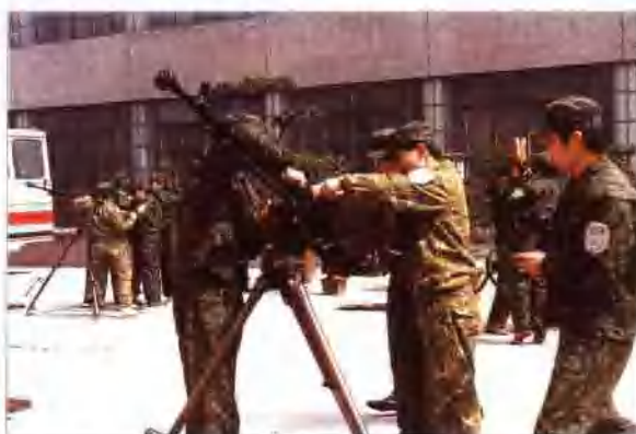
开展军民共建活动