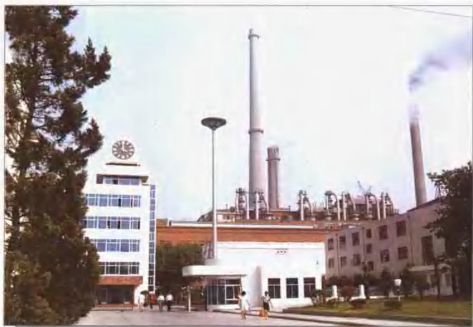
南京热电厂二号门