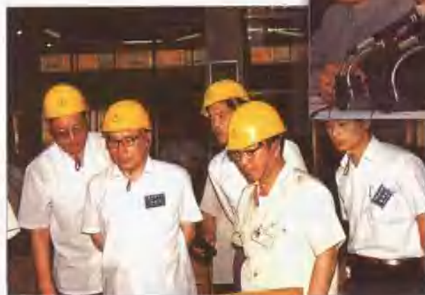
1992年6月15日原能源部 总工程师陆延昌来厂视察