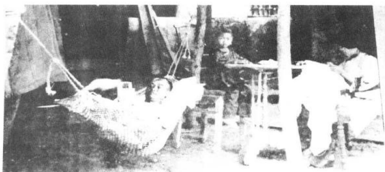
詹天佑在极艰苦的环境中修筑关外铁路，家居工地工棚中，照片吊床上读书者是詹天佑，右坐者是夫人，中坐女孩是他的长女。