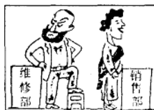
售前与售后 张涌泉 作