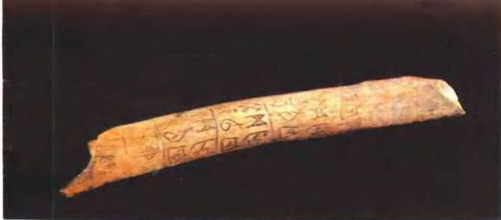
天津历史博物馆珍藏——商代甲骨“月有食”卜辞