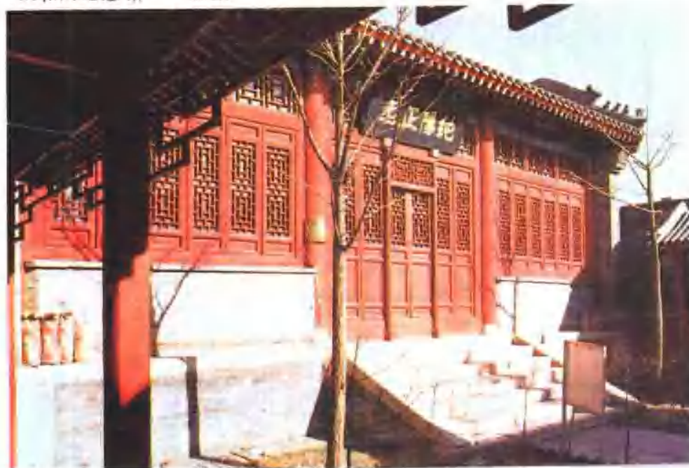
义和团纪念馆 —— 正殿