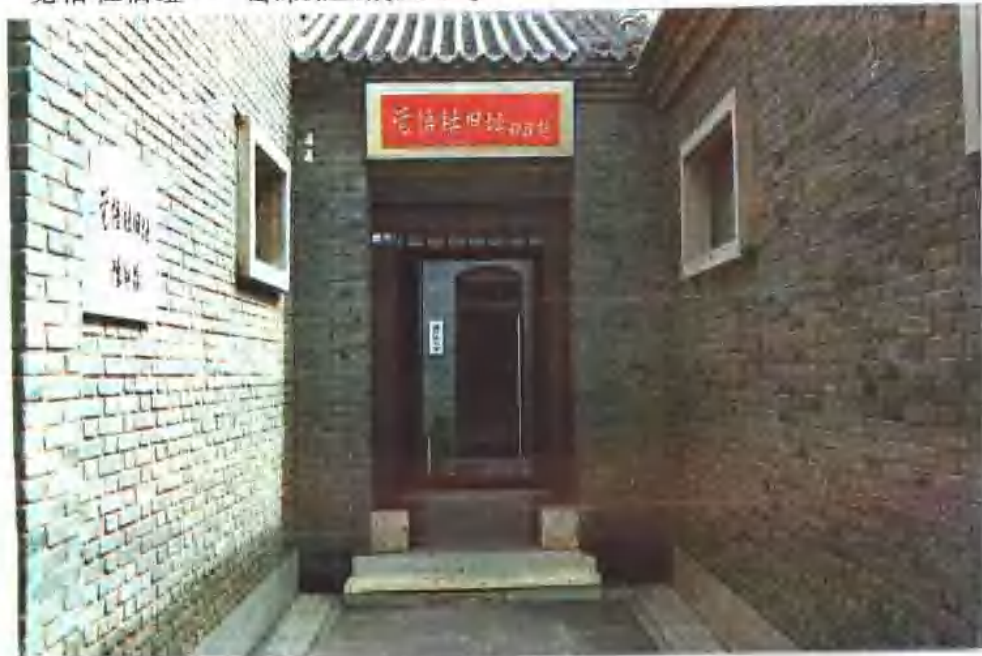
觉悟社旧址 —— 宙纬路三戒里4号