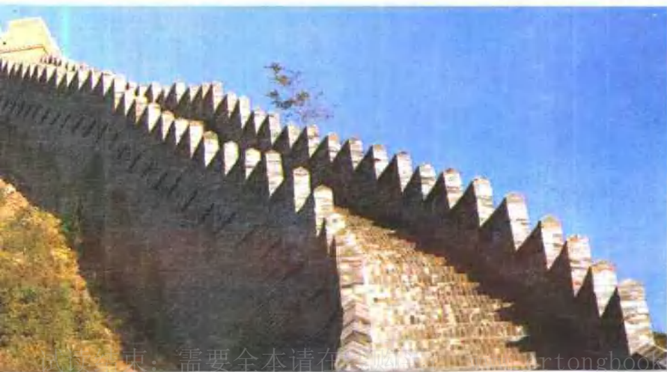
天津蓟县长城马道