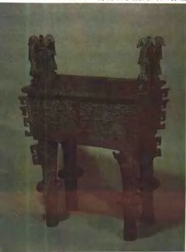
天津艺术博物馆珍藏西周太保鼎