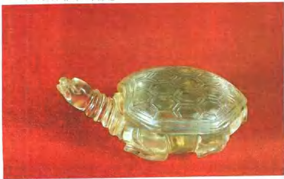
1983年蓟县白塔出土水晶龟