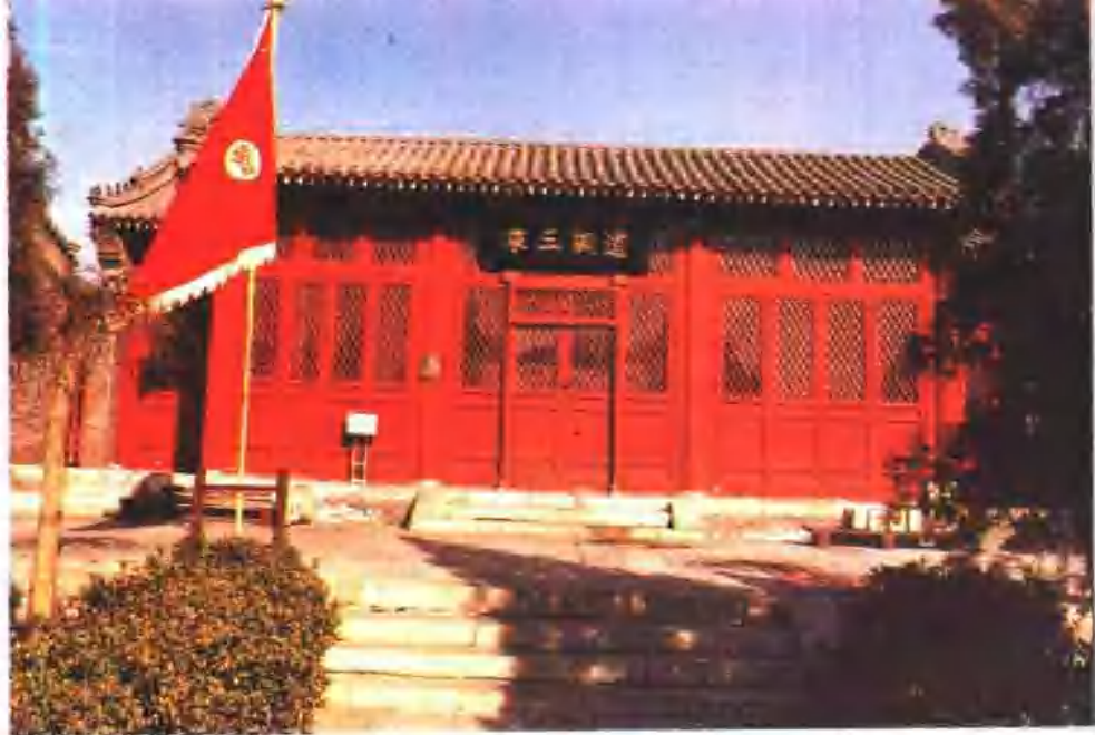
义和团纪念馆 —— 月台