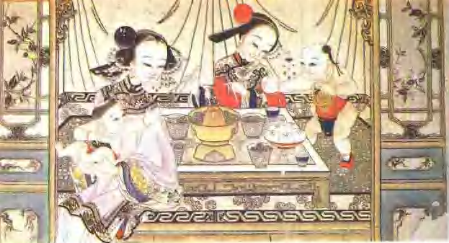
天津艺术博物馆收藏 清康熙版杨柳青年画《抚婴图》