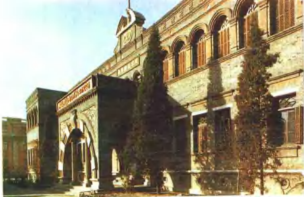
周恩来同志青年时代在天津革命活动旧址 —— 南开学校东楼