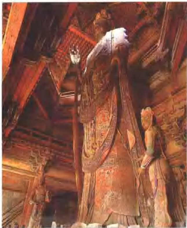
独乐寺十一面观音像