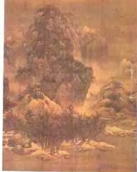
天津艺术博物馆珍藏 北宋范宽《雪景寒林图》轴