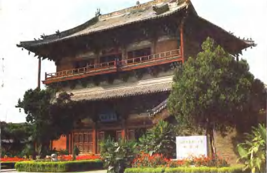
蓟县独乐寺观音大阁