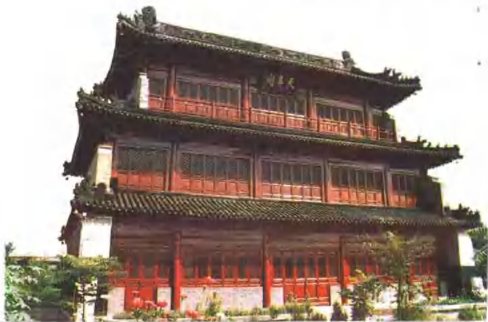
宁河丰台镇天尊阁