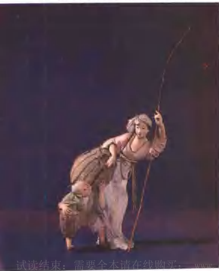
天津艺术博物馆收藏泥人张彩塑(二代)《渔妇》