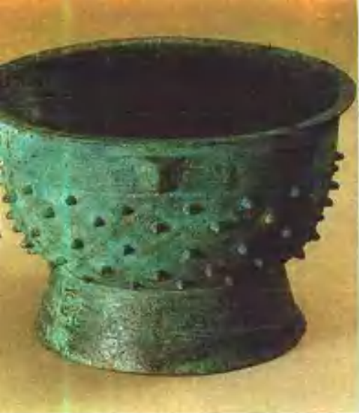
蓟县邦均西周遗址出土乳丁 铜簋