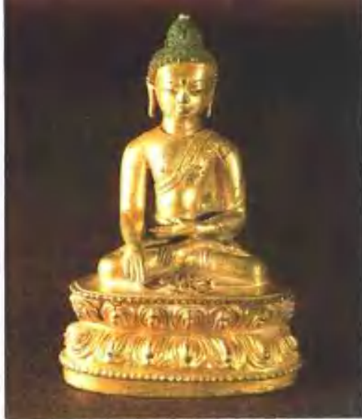
1983年蓟县白塔出土鎏金铜佛