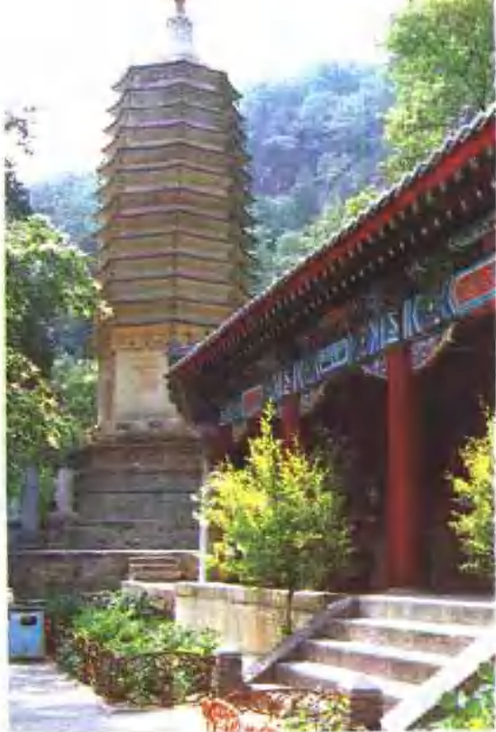
蓟县盘山天成寺之古佛舍利塔