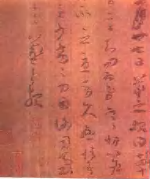
天津艺术博物馆珍藏 唐人摹本王羲之《寒切帖》