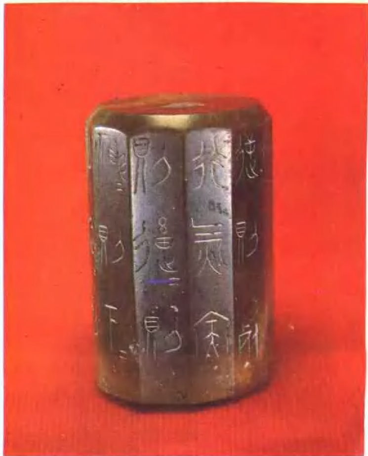
天津历史博物馆珍藏战国行气铭玉饰