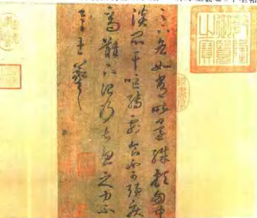
宋摹王羲之《干呕帖》