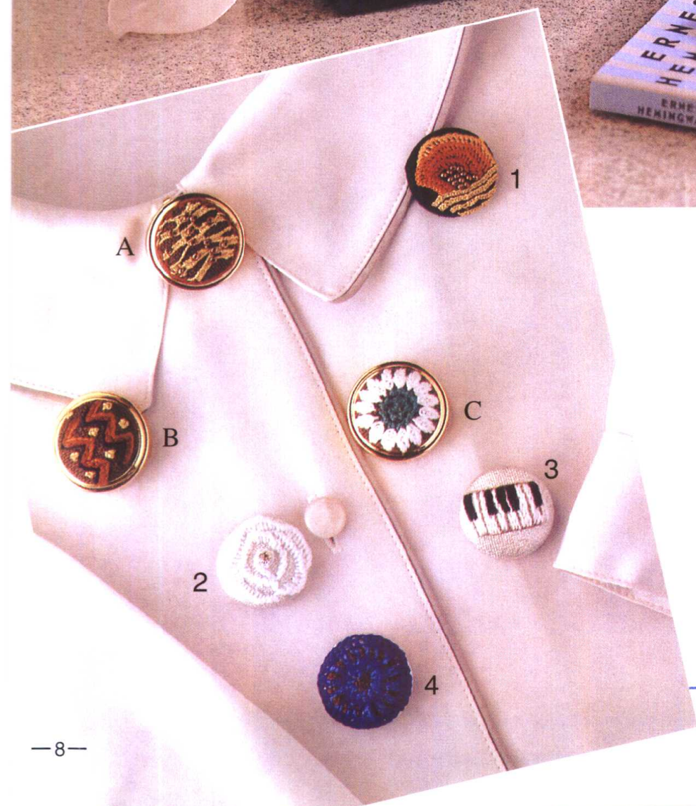
● 钮扣 · 钮扣套 ● 解说96页