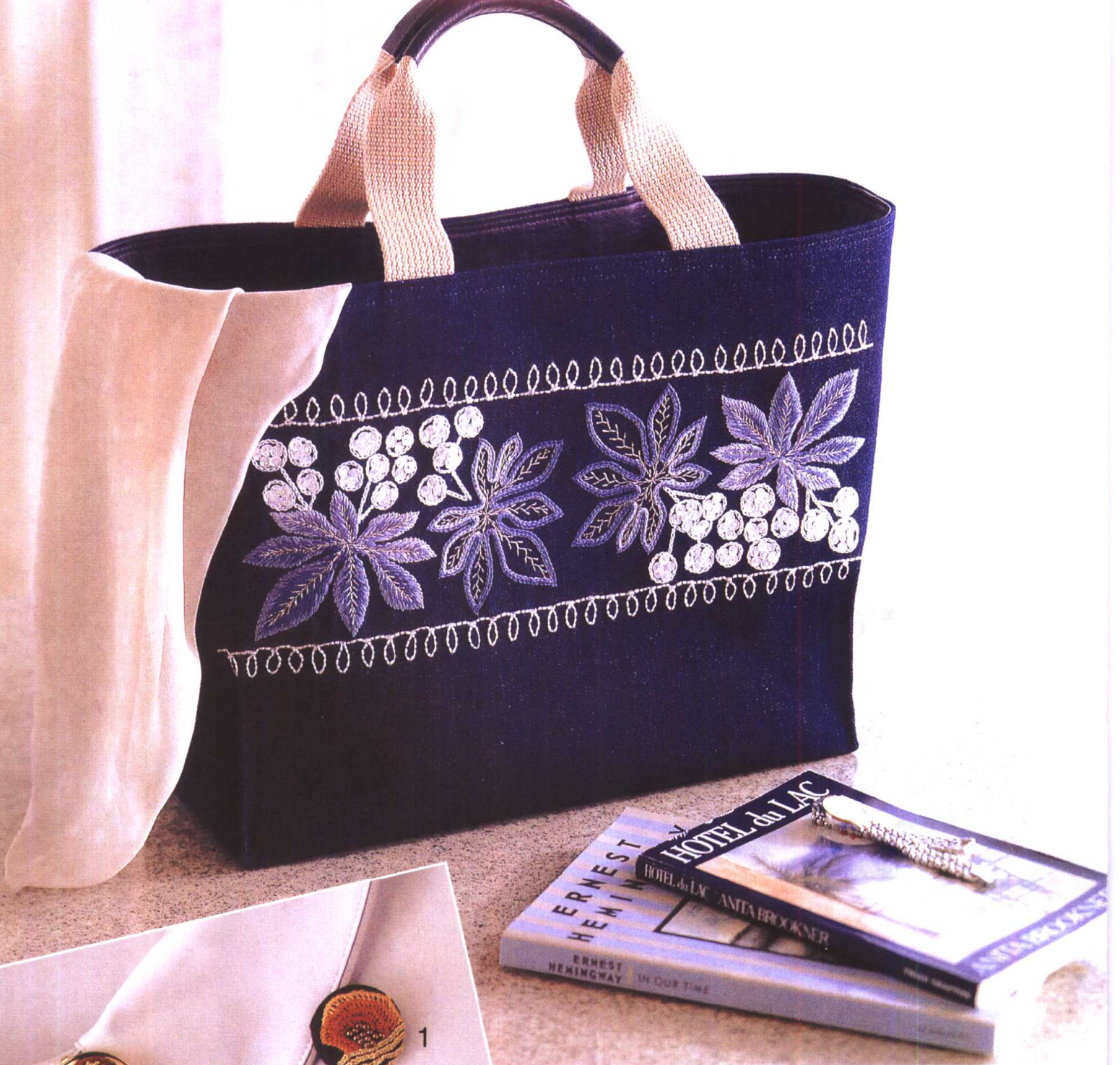
● 立式提袋 ● 解说46页