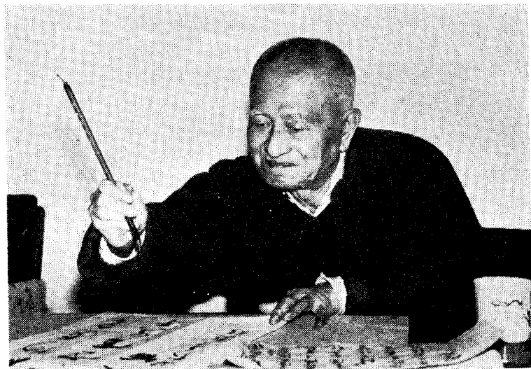
林散之八十一岁时像