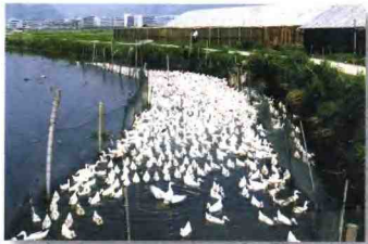
埭头村的规模饲养场