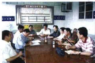
岭下村的村干部在讨论计划生育规划