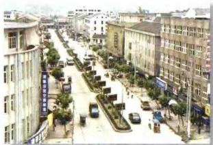
整洁有序的罗浮大街