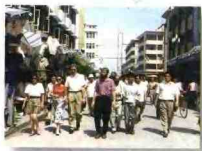
外国友人参观石浦村