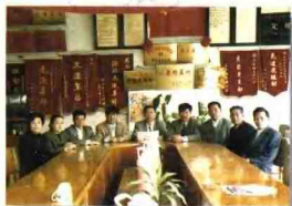
汀六村的干部珍惜这一项来之不易的荣誉