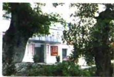
十八村的村委会办公楼在古榕树的映衬下，显得古朴、雅致