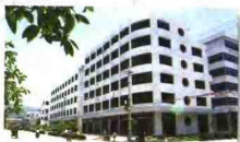
汀九村的村民住宅