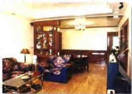
葡萄村一村民家庭