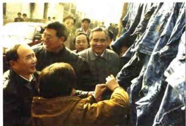
中共浙江省委书记李泽民（左一）在任桥村考察