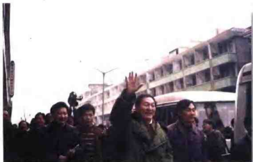
中共中央政治局常委、国务院副总理朱镕基到镇南村视察。 左一为浙江省委常委、温州市委书记张友余