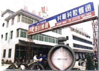
东方村生产的一只特大阀门，内径达1.5米