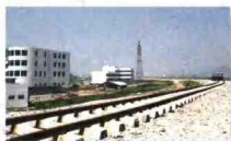
金温铁路从德政村工业区边经过