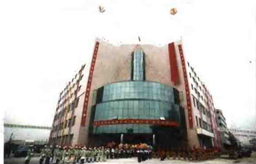
北村为慈湖大楼的落成举行了隆重的庆典