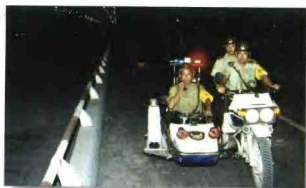
横法村的治安联防队在夜巡