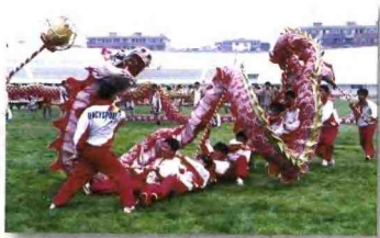
庄泉村的舞龙队曾获全国比赛表演奖