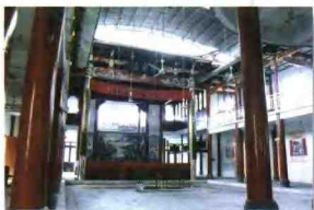
后坪村的大舞台是村民文娱活动的好去处