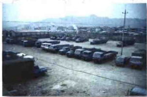
晨曦中的营楼桥村办停车场