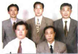
团结高效的王宅村领导班子