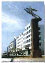
球头工业城的标志性 雕塑“飞马”