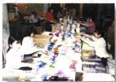
上庄村制笔厂的装搭车间