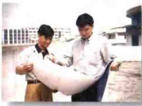
东风村的领导在展望发展蓝图