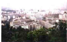
白岩桥村已融入都市的楼群中