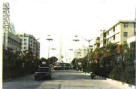
位于状元桥村的龙腾路是龙湾区的闹市