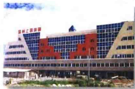
施工时的上园大厦