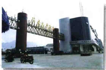
赵宅村瑞安汽配城的规模堪称华东一流