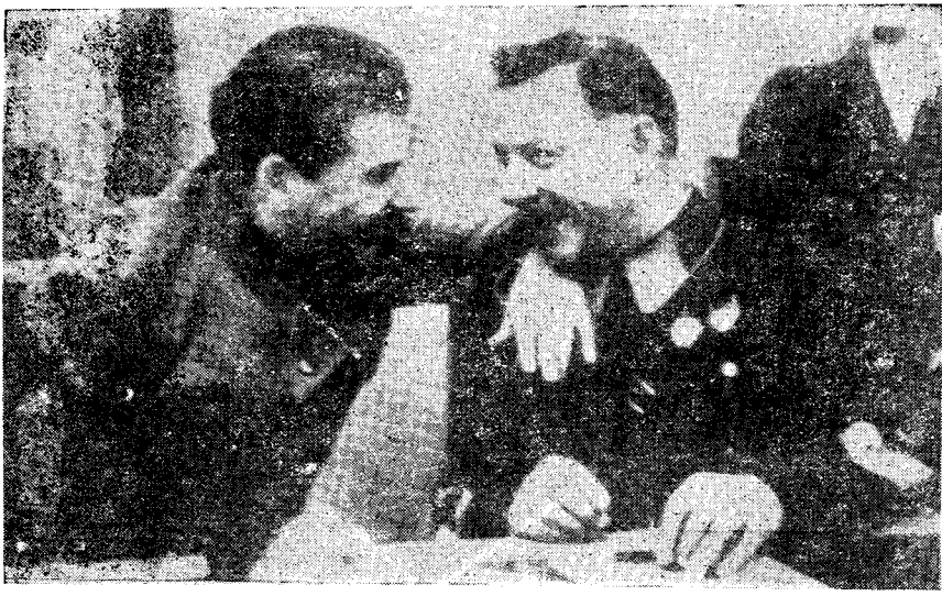
斯大林与伏罗希洛夫在1936年某次会议上。