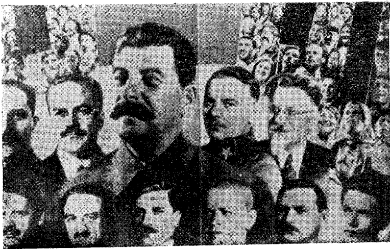
1937年苏联宣传照片。上排人物从左至右为：卡冈诺维奇、莫洛托夫、斯大林、伏罗希洛夫和加里宁；下排从左至右为：安德烈耶夫、米高扬、波斯蒂舍夫、柯秀尔、日丹诺夫和叶若夫。