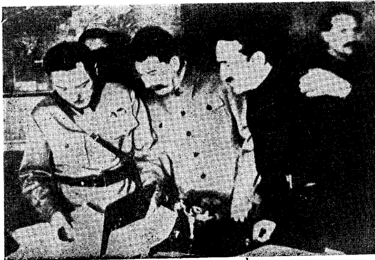
伏罗希洛夫、斯大林、米高扬(从左至右)在1936年一次斯达汉诺夫工作者代表会议上；后排右上方者是卡冈诺维奇。