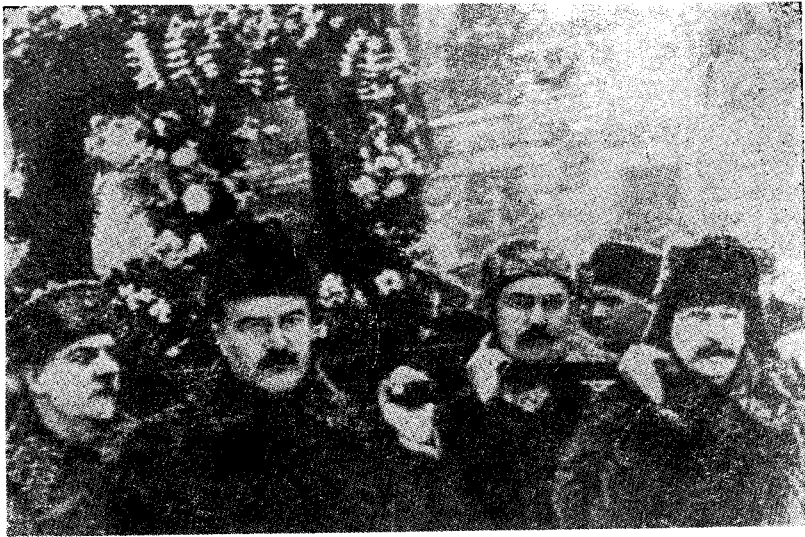
1937年奥尔忠尼启则葬礼上的四位扶灵人，从左至右为： 伏罗希洛夫、莫洛托夫、卡冈诺维奇和斯大林。

1939年8月莫洛托夫签署苏德条约，在他身后从左至右站立者为：德国外交部长里宾特洛甫和斯大林。