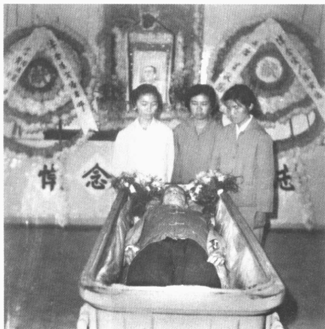
女兒流求、小彭、美延與父親告別 一九六九年十月十七日於廣州殯儀館告別儀式