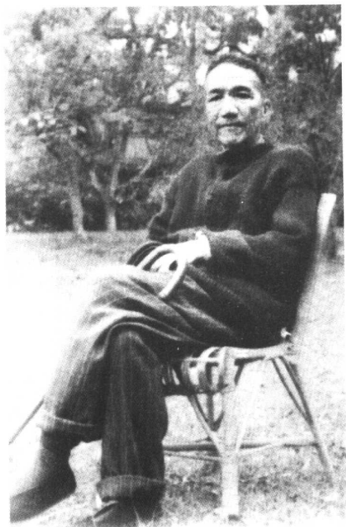
攝於廣州中山大學東南區一號草坪 一九六一年