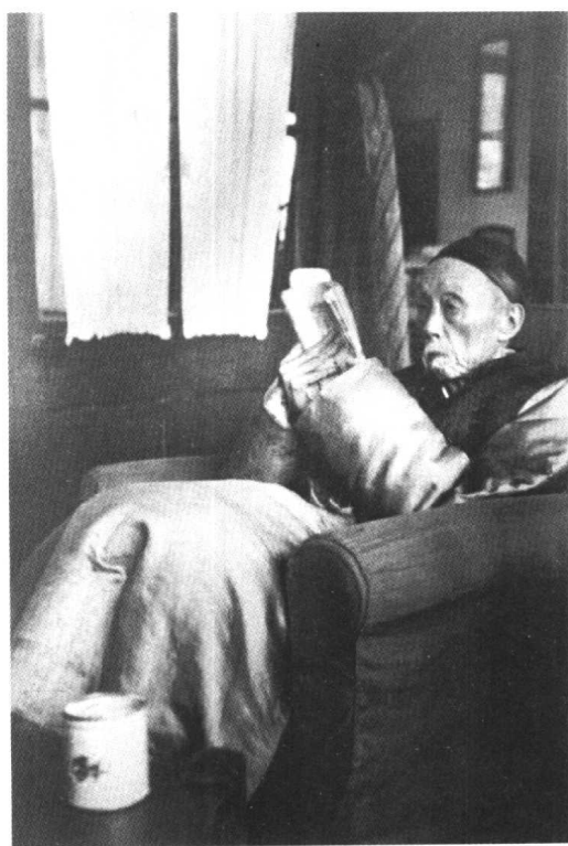
散原老人於北平姚家胡同三號 寓所內 一九三五(六?)年