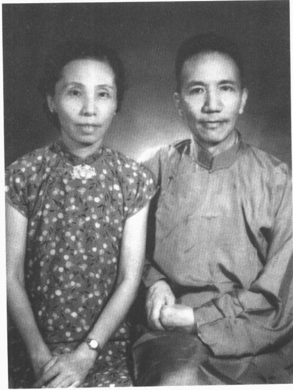
結婚廿三年紀念合影 一九五一年八月