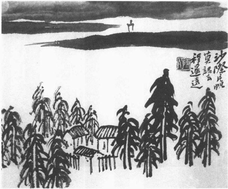
長兄師曾畫作「沙際片帆」