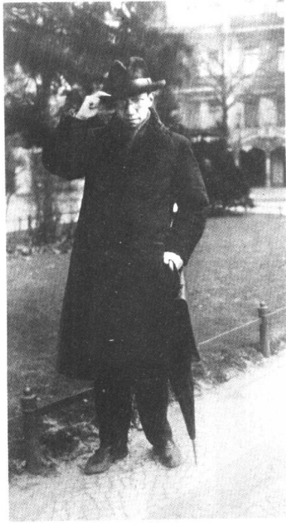
青年時代攝於柏林