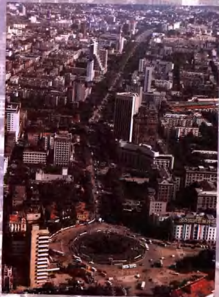
哈尔滨市市区鸟瞰