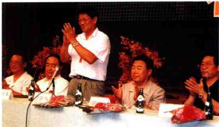
① 中共中央政治局委员李铁映出席纪念黑龙江人民广播诞生五十周年大会