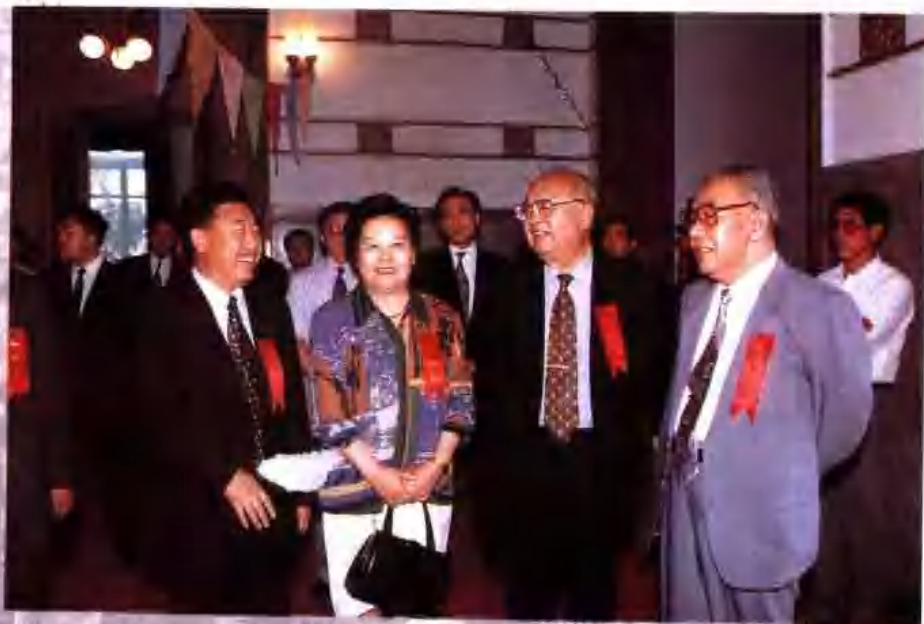
①全国人大常委会副委员长王光英和夫人在省委书记岳岐峰、省长田凤山的陪同下，参观第六届中国哈尔滨边境地方经济贸易洽谈会展厅