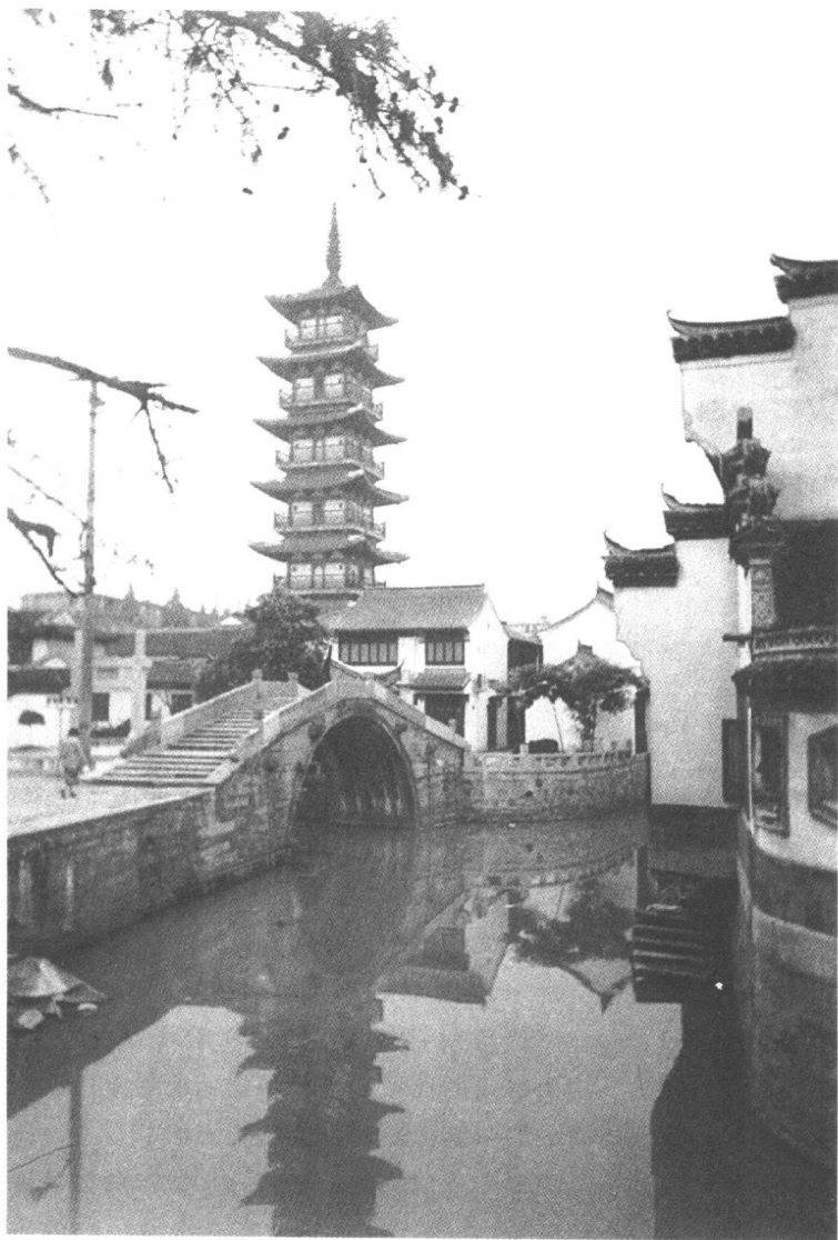
水光塔影(位于练祁河和横沥河交汇处的嘉定法华塔)