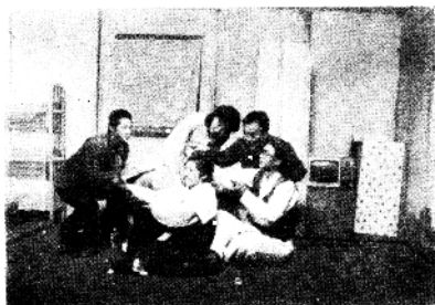
▷ 给表演系学生上课