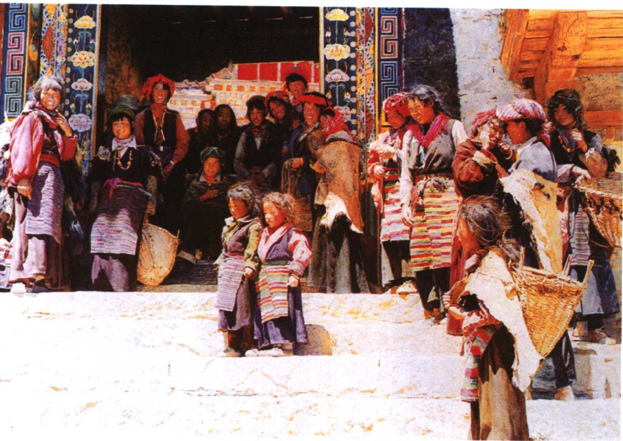
照相 58 × 88cm 姚建平 (5届展作品)