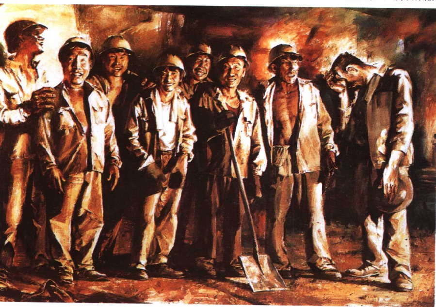
钢火 76 × 109cm 杨奕荣 (5届展作品)