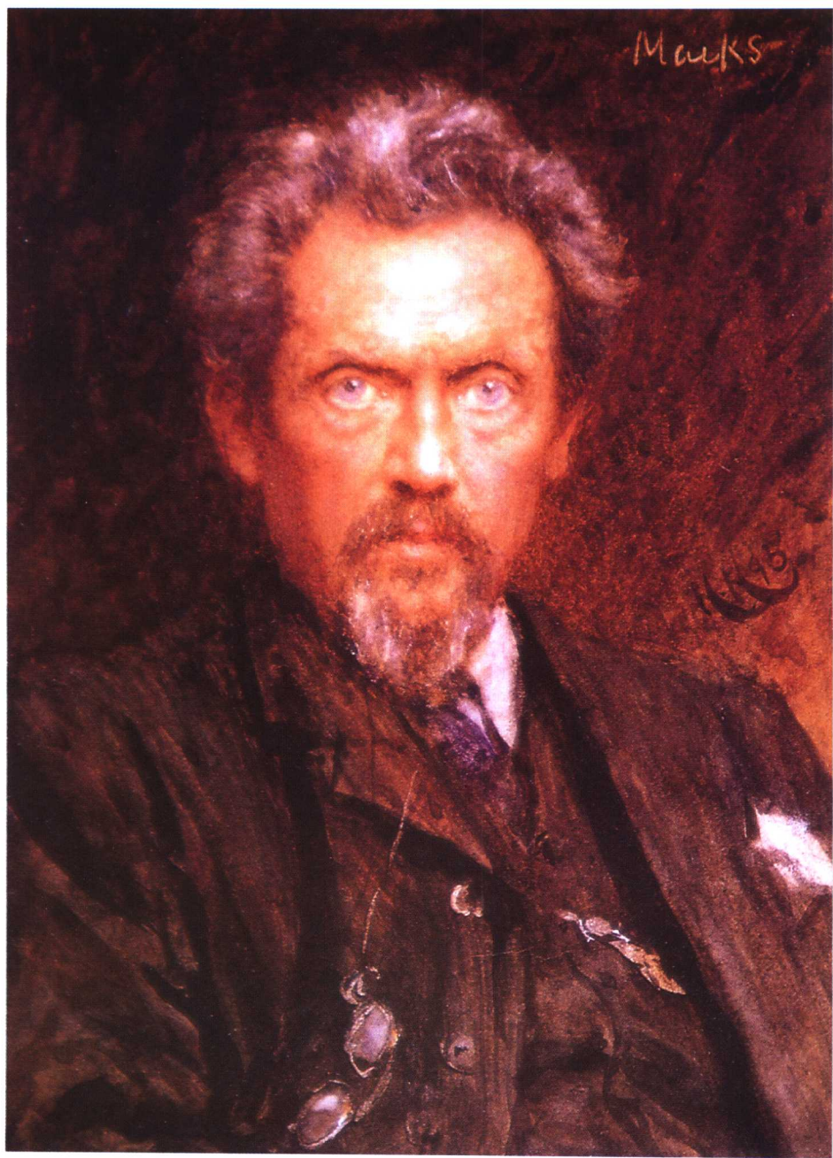
斯太塞·马克斯的肖像 霍勃特·温·荷科梅尔 备注：水彩树胶及刀刮