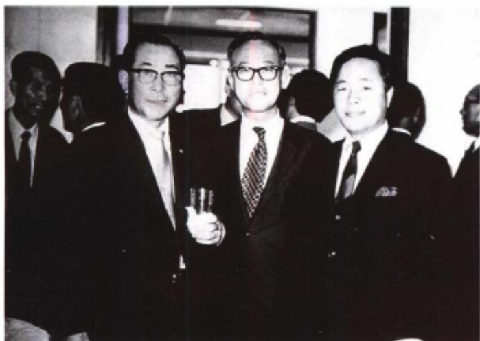
1971年庆祝金俊焯先生(左二)主编、高丽大学亚洲问题研究所出版《旧韩国外交文书》30卷全部出齐。右一为现任韩国总统金泳三，时任民主党总裁。