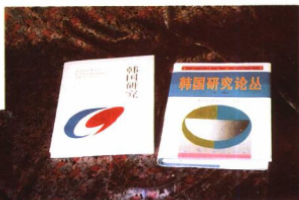
北京大學、杭州大學、遼寧大學、復旦大學出版韓國學論文集。