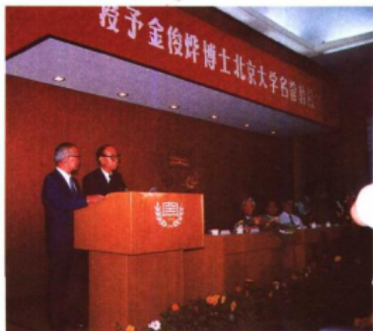
1993年金俊焯先生在北京大学授予他名誉教授仪式上致词。