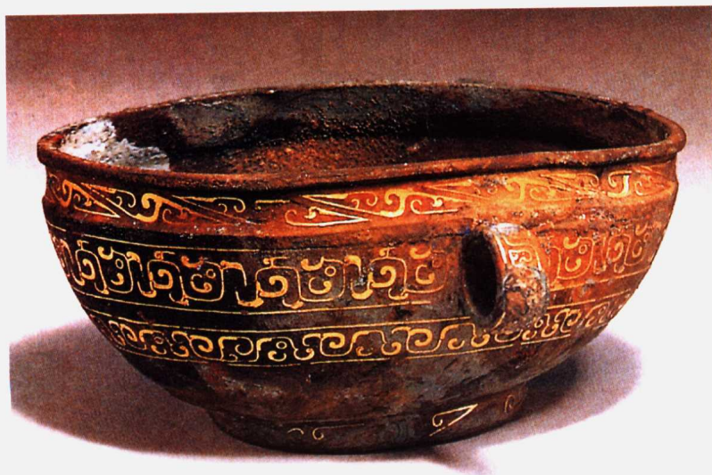
(战国) 镶金青铜盘(饮酒器)