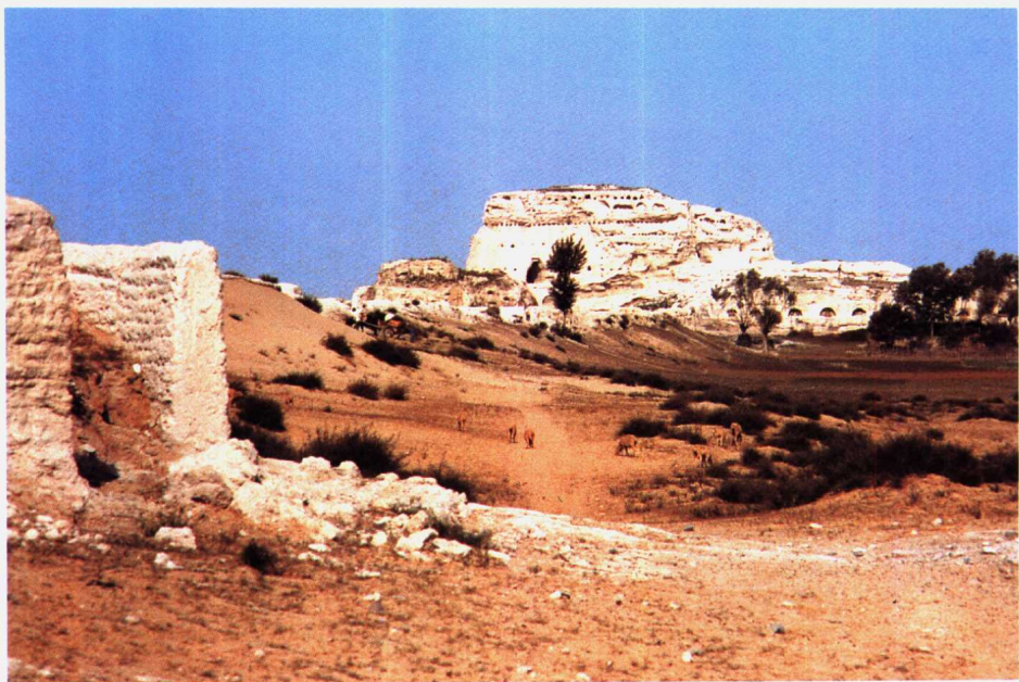
(西夏) 陕西省靖边县统万城遗址