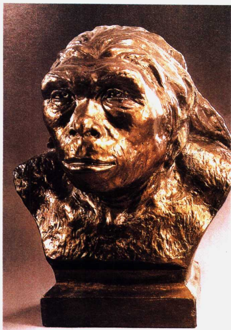
蓝田猿人头像(复原)