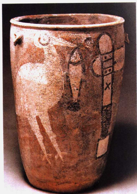
(新石器时代) 红陶彩绘 鹤·鱼· 石斧纹缸