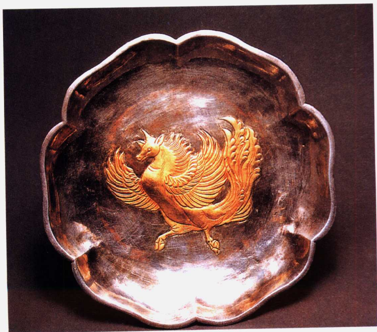
(唐) 鎏金神兽纹银盘