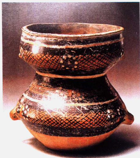
(新石器时代) 彩陶 网纹束腰罐