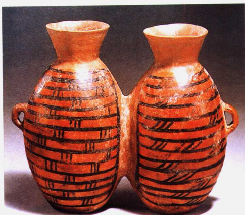
(新石器时代) 彩陶双连壶