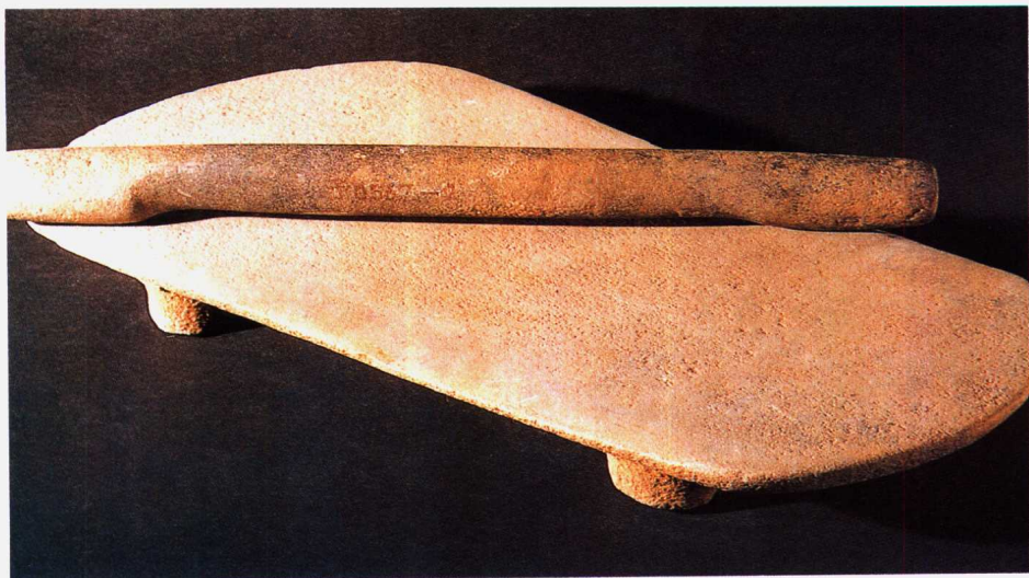
(新石器时代) 磨盘 磨棒