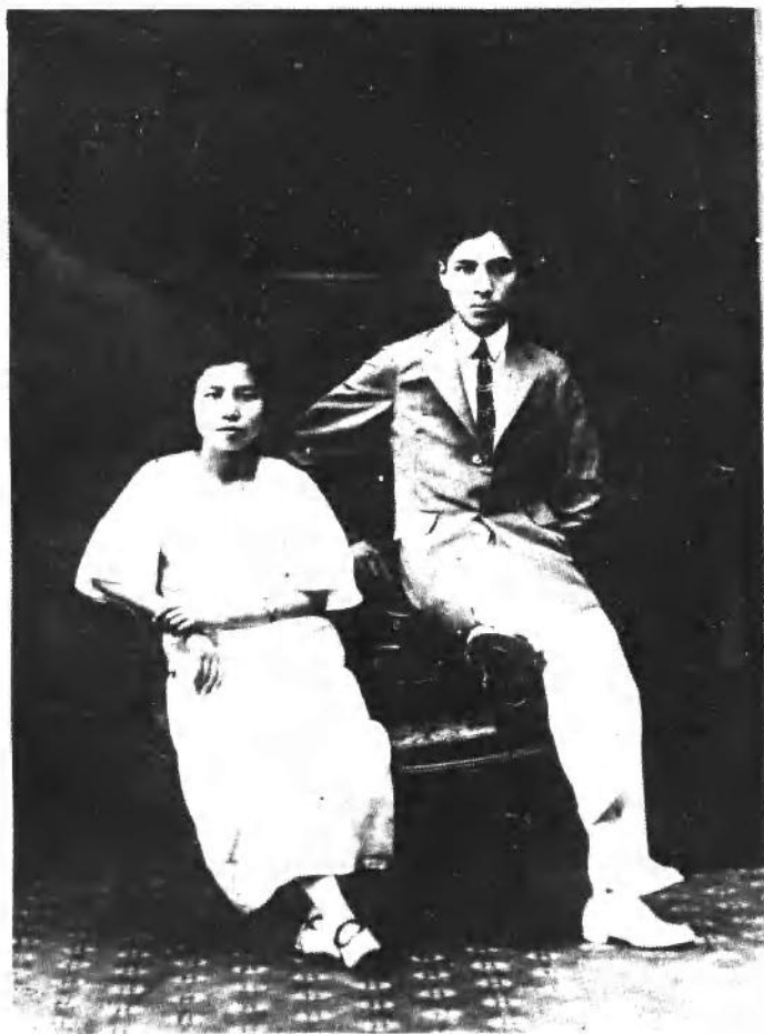
李硕勋和夫人赵君陶同志