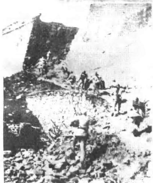
吴化文部起义 后的第五天，我军 攻克济南