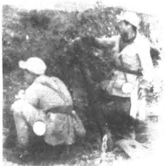
一九四八年 九月十八日夜， 我军西线部队炮 击吴化文部簸箕 山阵地