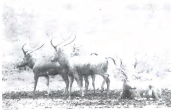
麋鹿苑部分麋鹿