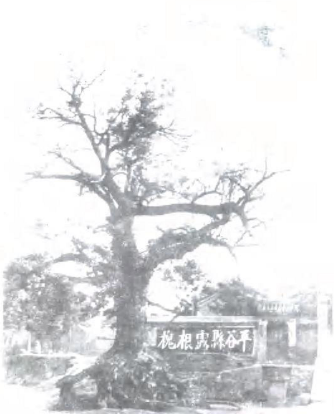
平谷旧城的露根槐（平谷县政协供稿）