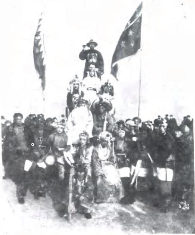
京西秧歌会—— 龙泉务村“状元拜塔”