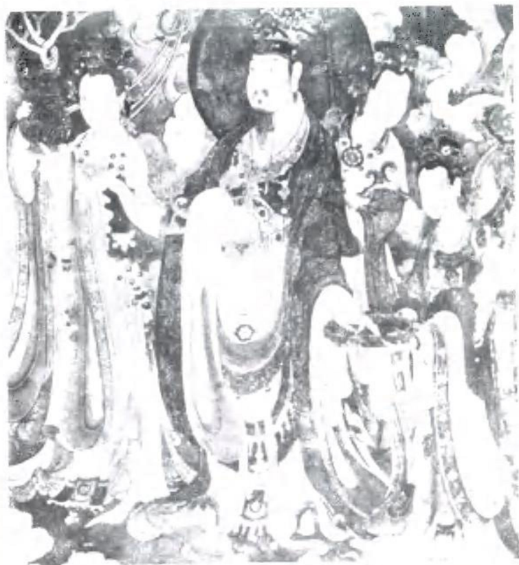
大梵天王（法海寺壁画局部） （石景山区政协供稿）