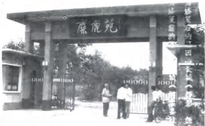
大兴县麋鹿苑正门