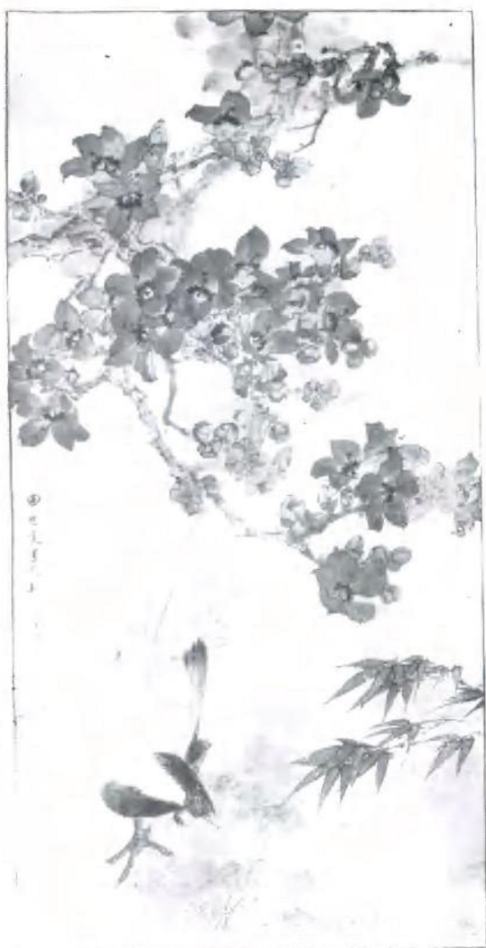
田世光的工笔花鸟画