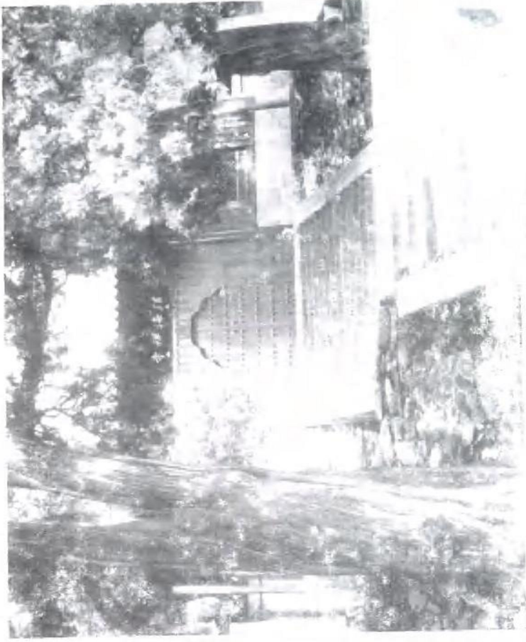
法海寺外景（石景山区政协供稿）