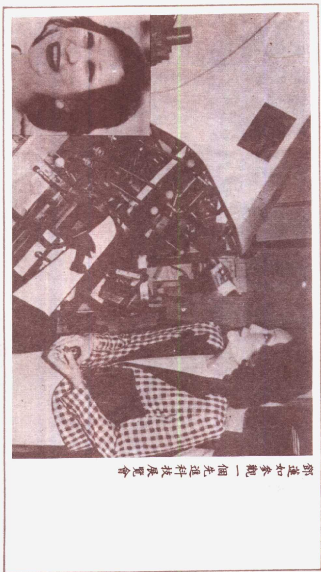
鄧蓮如參觀一個先進科技展覽會