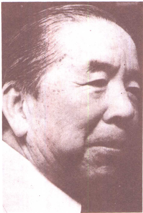
商界奇才包玉剛——今次船難未能傷他分毫