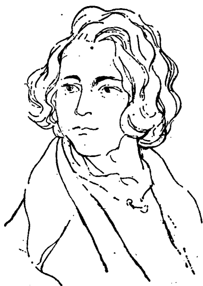
狄 更 斯