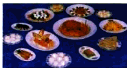
东兴饭庄名菜名点