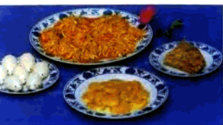
金苑酒家名菜名点