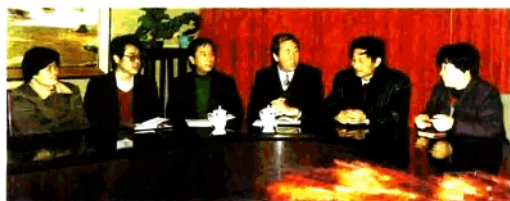
领导班子在研究工作