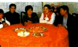
金苑酒家领导班子在研究工作