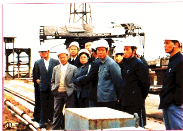
1、中国工商银行行长张肖(左五)在福州经济技术开发区视察工作。