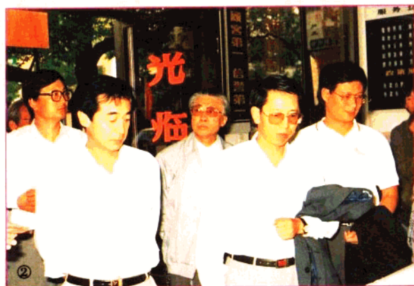
2、中国工商银行副行长刘廷焕(右二)在福州视察工作。

3、1993年4月省人民政府副省长刘明康(左四),省人行行长林敬耀(左五)及省各家银行(公司)领导参加福州市金融同业公会成立五周年庆祝大会。