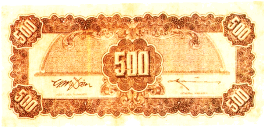
民国三十四年福建百城印务局所印中央银行 500 元纸币