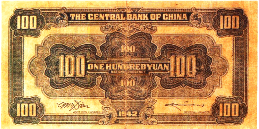
民國三十一年福建百城印務局所印中央銀行 100 元紙幣