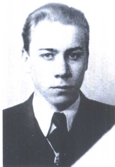
洛塔尔·弗洛赫 (洛特卡)