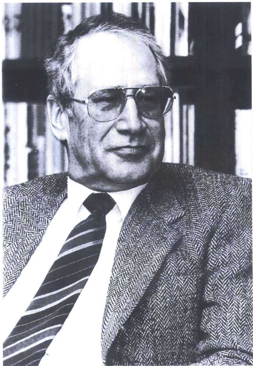
马库斯·沃尔夫，1989年于柏林