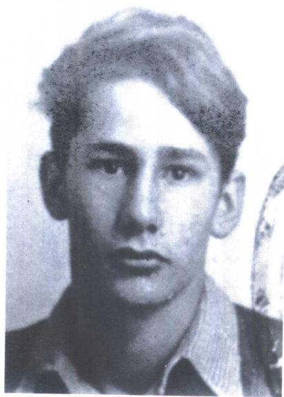
马库斯·沃尔夫 (米沙)