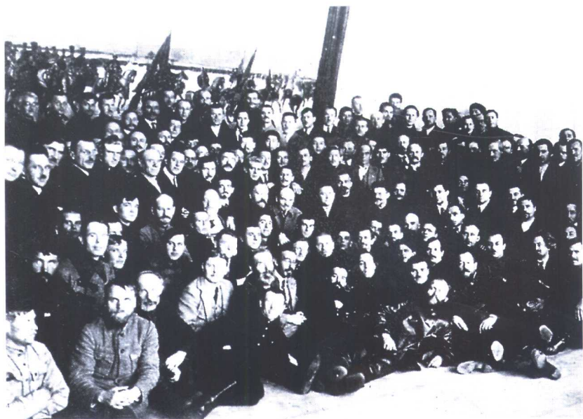
1922年10月，列宁与参加俄国中央执委会的代表合影，列宁右手第六人为路易·费希尔