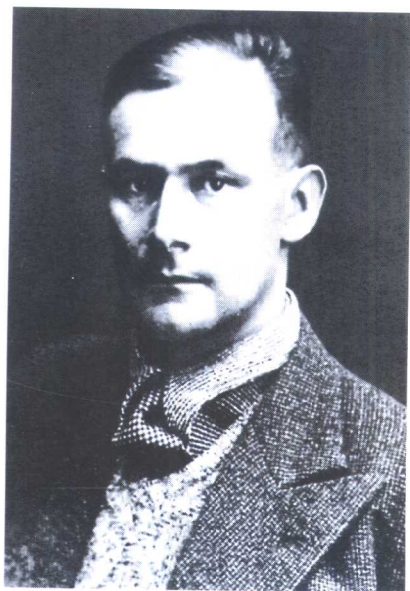
弗里德里希·沃尔夫