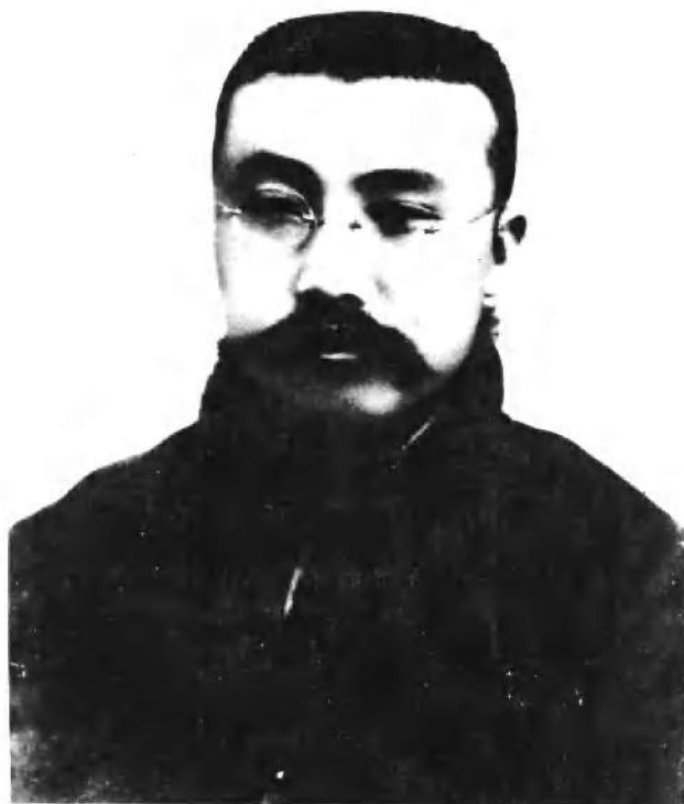
李 大 钊