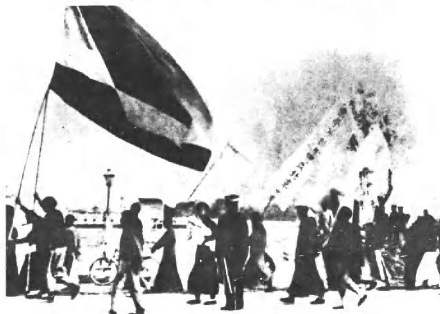
一九一九年五月“五四”爱国运动爆发，图为北京大 学的游行队伍。