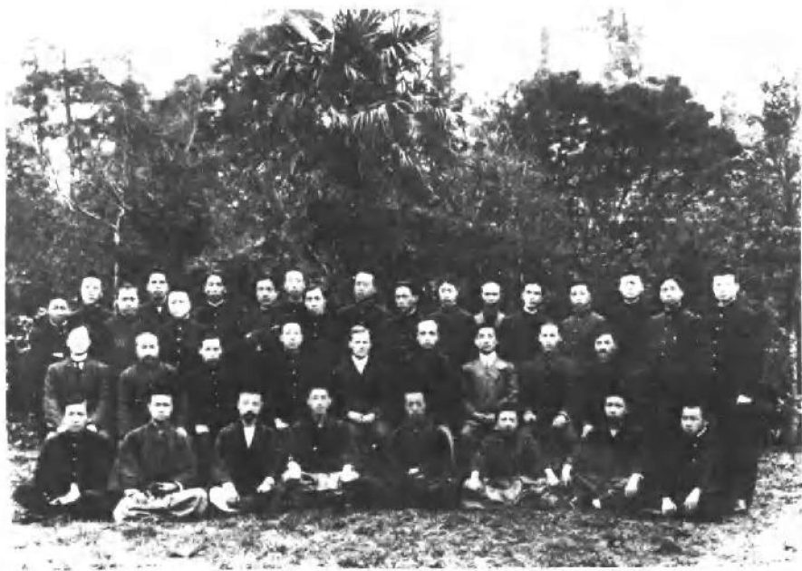
一九一四年，李大钊考入东京早稻田大学政治本科学 习。图为李大钊（前排左三）与教员、同学们的合影。