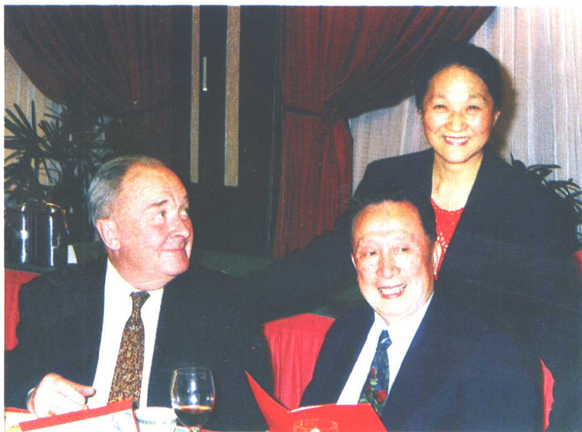
1997年吴阶平夫妇与杨森博士在一起