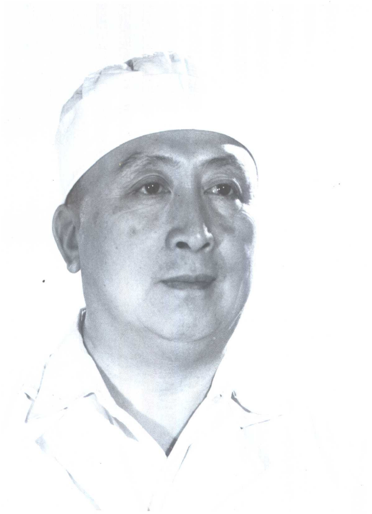
我国著名泌尿外科医生吴阶平