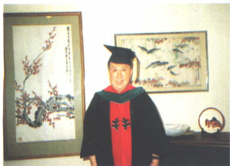
在接受美国医师学院荣誉院士称号之前 身着协和博士服的吴阶平