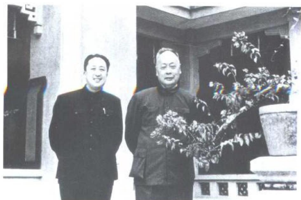
1966年2月与陈毅同志在广东从化合影