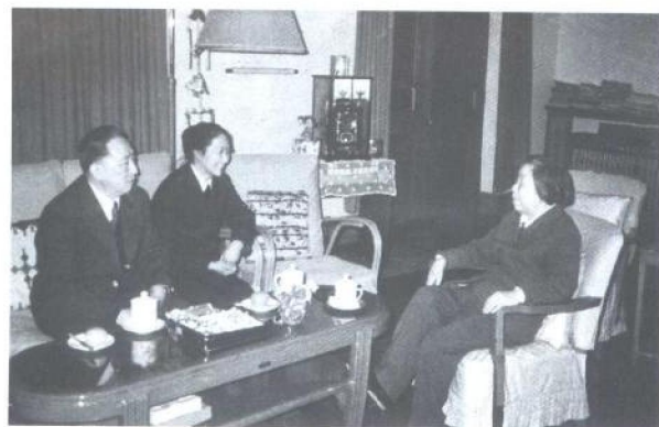
1984年吴阶平带着妻子高睿来到中南海西花厅看望邓颖超同志