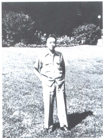
吴阶平在美国芝加哥大学进修，师从现代著名泌尿外科专家、诺贝尔医学奖获得者哈金斯教授（摄于1948年）