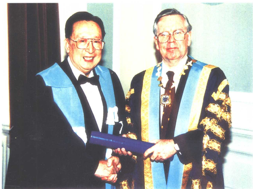
· 1996年11月接受爱丁堡皇家外科医师学院荣誉院士称号