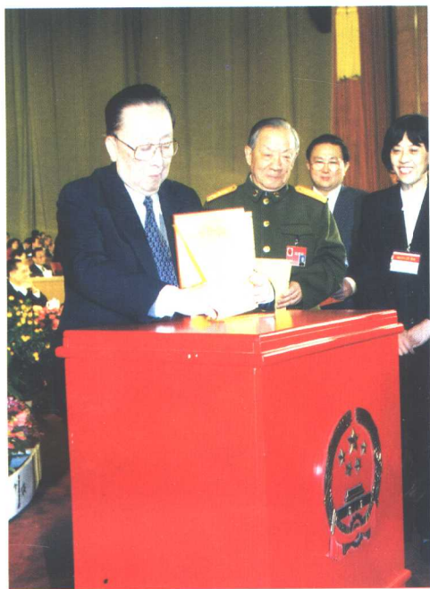
吴阶平在人大会议上投下 庄严一票