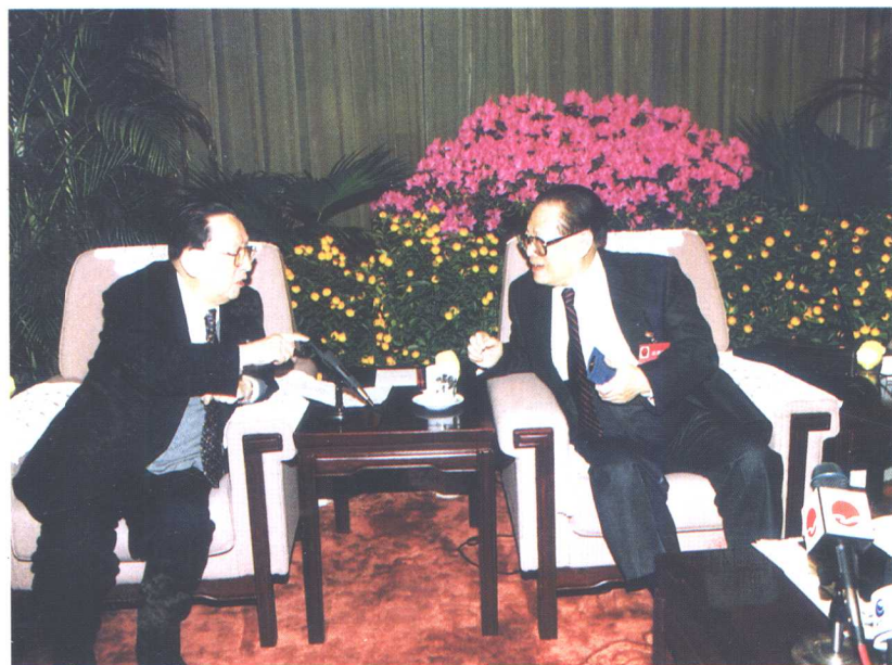
江泽民同志与吴阶平亲切交谈