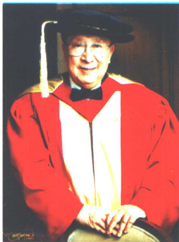
1997年接受香港中文大 学荣誉理学博士学位