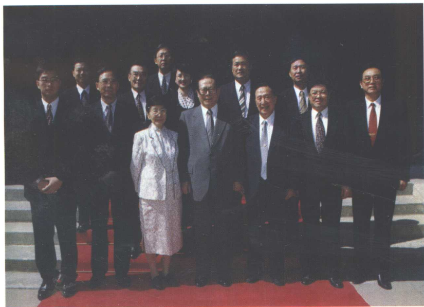
吴阶平堂姐吴舜文女士（前排左三）受到江泽民总书记的接见 （前排右三为吴阶平）