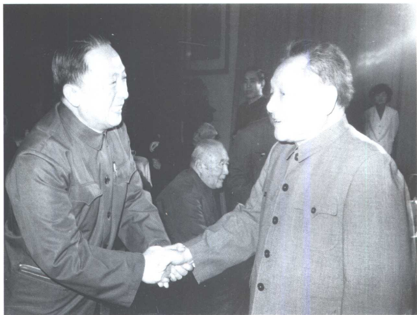
1981年与邓小平同志在一起